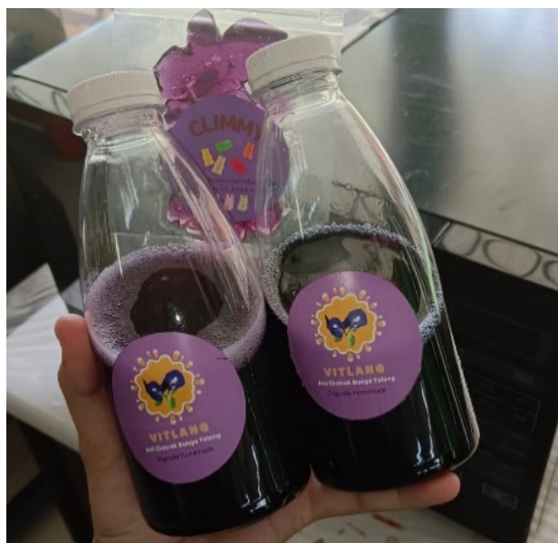
Gambar 2. Minuman Berkarbonasi Bunga Telang

oleh masyarakat serta banyak manfaatnya untuk kesehatan. Permen jelly juga dibuat dengan bahan dasar bunga telang karena dapat dengan mudah serta disukai oleh anak-anak karena pada umumnya anak-anak menyukai permen yang memiliki rasa manis dengan warna yang menarik yang dihasilkan oleh bunga telang yaitu berwarna biru hingga ungu. Pada tahap kedua pengabdian kepada masyarakat ini dilakukan demonstrasi pembuatan minuman berkarbonasi dari bunga telang yang dimulai dengan cara penyiapan bunga telang yang dikeringkan terlebih dahulu dengan cara penjemuran dibawah sinar matahari yang ditutupi dengan kain hitam sampai kering, kemudian bunga telang yang telah kering dibuat konsentrasinya dengan cara merebus bunga telang tersebut dan setelah jadi ditambahkan bahan tambahan untuk membuat minuman karbonasi berupa pencampuran asam dan basa sehingga didapatkan senasai gas CO 2 pada saat dikonsumsi. Asam yang digunakan untuk membuat minuman berkarbonasi ini adalah asam sitrat sedangkan basa yang digunakan adalah natrium bikarbonat. Untuk rasa yang dihasilkan dari minuman berkarbonasi ini dari bunga telang berupa manis dan ada sensasi gas karbondioksida pada lidah serta memiliki warna yang menarik karena adanya perubahan warna dari bunga telang yang awalnya berwarna biru setelah penambahan asam berubah menjadi ungu. Minuman berkarbonasi dari bunga telang dapat dilihat pada gambar 2 dibawah ini.