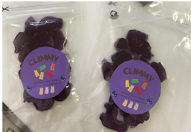
Gambar 3. Permen Jelly Bunga Telang

dikembangkan sehingga didapatkanlah permen jelly dengan tekstur yang baik. Permen jelly dari bunga telang yang dibuat dapat dilihat pada gambar 3. Pada tahap ini juga dilakukan pretest dan post test didapatkan juga hasil bahwa terjadi peningkatan pengetahuan terkait pembuatan permen jelly dari bunga telang dapat dilihat pada gambar 1.