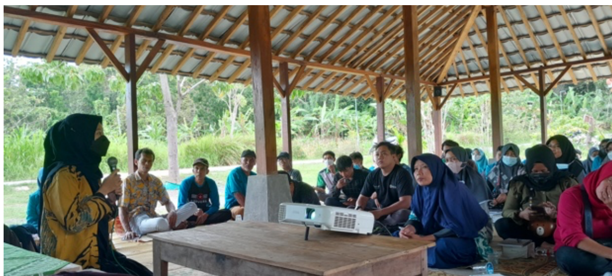
Gambar 2. Proses penyajian materi

Pelatihan pengelolaan bisnis Syariah yang dilakukan oleh dosen di lingkungan program studi ekonomi Syariah ini sengaja dilakukan guna memberikan wawasan pada pelaku umkm serta memberikan solusi atas masalah yang dihadapi dalam hal pengelolaan bisnis. Sebelum pelatihan dilakukan kami melakukan mini riset terkait dengan kendala dan masalah yang dihadapi oleh pelaku UMKM didesa Wisata Banjaran kelurahan guwosari, Adapun beberapa masalah yang dihadapi adalah permasalahan pada penyusunan keuangan, persaingan bisnis yang kurang sehat, legalitas usaha yang tidak lengkap serta pengembangan bisnis yang sulit (Marsuking et al., 2022).