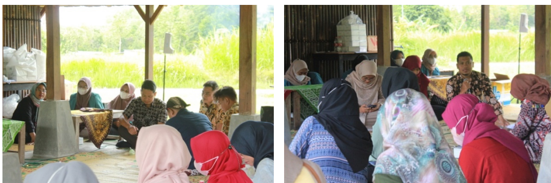
Gambar 3. Diskusi dan Group Sharing

Kegiatan pelatihan ini mendapat antusias yang baik dari pelaku UMKM terbukti dari banyaknya peserta yang hadir dan keaktifan peserta dalam menyampaikan pertanyaan dan masalah-masalah yang dihadapi.