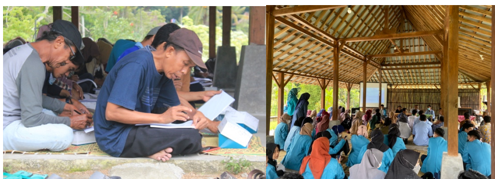
Gambar 1. Proses Pelaksanaan Pelatihan

tentang manfaat-manfaat yang didapatkan. Pertemuan pertama ini dibentuk kelompok antar peserta yang nantinya akan diberikan pretest dan posttest guna mengukur pemahaman dan kemampuan peserta pelatihan. Pelatihan dihari pertama ini diisi oleh beberapa Dosen Ekonomi Syariah Universitas Alma Ata yang pada saat itu yang ditugaskan adalah beliau Al Haq Kamal, S.E.I., M.A. dan Ibu Baiq Ismiati, S.E.I., M.E. yang menyampaikan secara awal terkait proses memulai suatu bisnis dan membantuk suatu brand bisnis. Diakhir sesi pelatihan pertama ini diakhiri dengan pembukaan sesi diskusi serta post test yang lakukan oleh seluruh peserta. Meski sesi pertama sudah berakhir namun pihak Dosen Ekonomi Syariah Membuat sebuah Group diskusi melalui media Whatsapp agar para peserta tetap bisa konsultasi tentang bisnisnya selagi menunggu pelatihan minggu kedua dimulai. Pelatihan dilanjutkan pada minggu kedua, diminggu kedua ini pelatihan terfokus pada materi-materi yang bersifat teoritis tentang bisnis Syariah, materi diminggu kedua ini disampaikan oleh Febrian Wahyu W, S.E., M.E., Abdul Salam, S.E.I., M.A. dan Ahmad Yunadi, S.E.I., M.A. hal ini dilakukan guna memberikan pemahaman secara teori tentang pengelolaan bisnis Syariah.