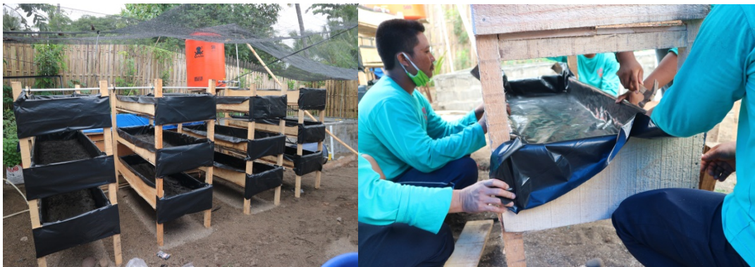
Gambar 2. Pembuatan wadah rak budidaya cacing sutra

Pembuatan wadah budidaya cacing sutra dapat terbuat dari kayu, sawah, plastik apartemen, yang dapat menampung lumpur dan air. Wadah harus dilengkapi dengan aliran air yang kontinyu setiap waktu. Pada kegiatan pengabdian masyarakat di desa way gelang menggunakan wadah yang bertingkat menggunakan kayu.