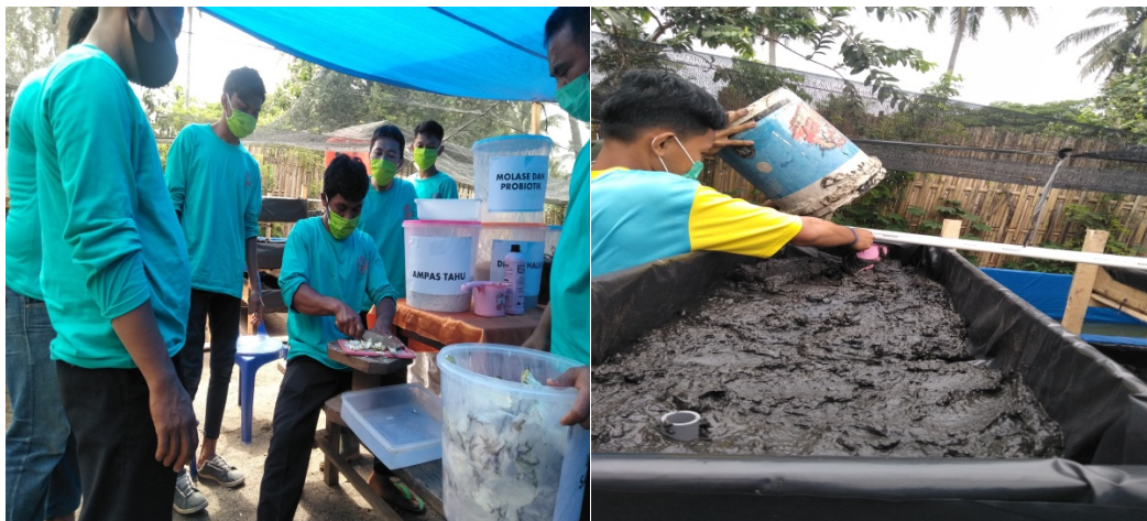
Gambar 3. Pembuatan Fermentasi dan Media lumpur untuk cacing