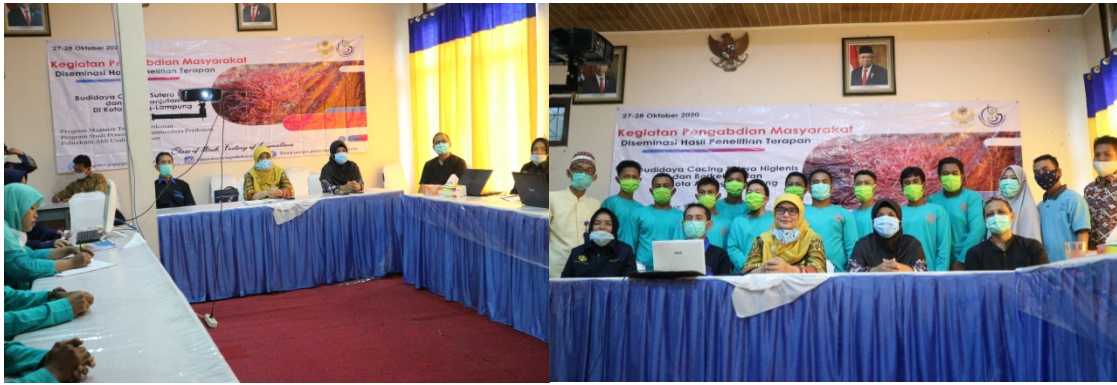
Gambar 1. Kegiatan pemaparan materi budidaya cacing sutra

Pembuatan wadah budidaya cacing sutra dapat terbuat dari kayu, sawah, plastik apartemen, yang dapat menampung lumpur dan air. Wadah harus dilengkapi dengan aliran air yang kontinyu setiap waktu. Pada kegiatan pengabdian masyarakat di desa way gelang menggunakan wadah yang bertingkat menggunakan kayu.