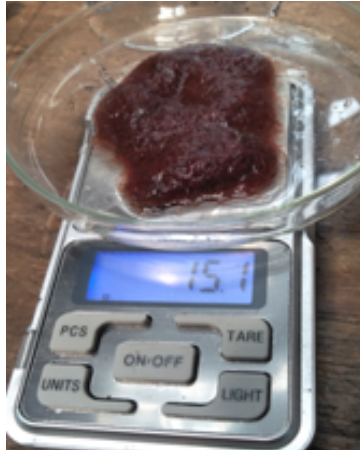
Gambar 4. Menimbang bibit cacing sutra