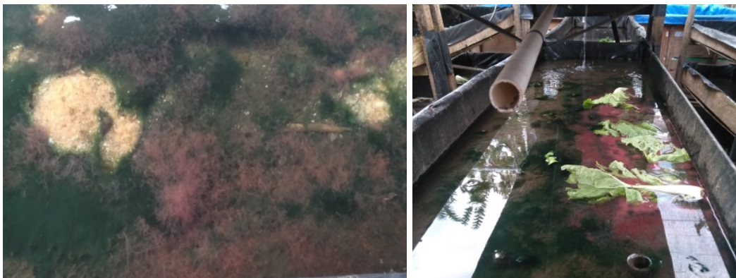
Gambar 5. hasil budidaya cacing sutra sutra pengabdian