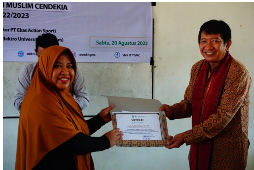
Gambar 2. Pemberian Sertifikat Kerjasama dalam Pembuatan Kurikulum

ke 5 yang dikenal dengan 5G Teknologi terus berkembang sehingga perlu update teknologi dan sensor dengan mengetahui Internet of Think terbaru. Pemaparan telah dilaksanakan sesuai dengan gambar 1. Selanjutnya gambar 2 memperlihatkan pemberian penghargaan dan cendera mata sesuai dengan hasil kurikulum sementara yang kemudian di perbaharui sampai semester depan dapat diberlakukan kurikulum baru. Pada gambar ke3 sesi foto bersama dilanjutkan dengan diskusi setiap mata pelajaran yang diberikan dalam pengajaran. Kegiatan diskusi per mata pelajaran dilakukan secara parallel melibatkan guru pengampu setiap mata pelajaran.