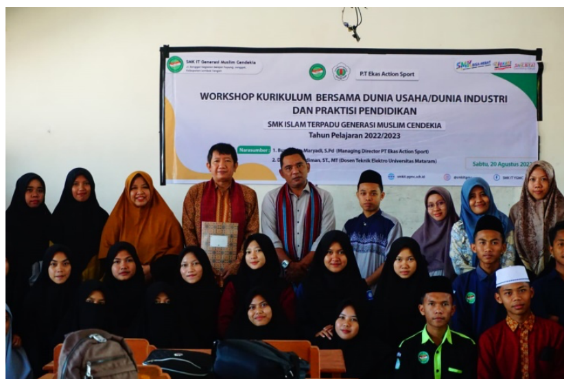
Gambar 3. Foto Bersama Antara Penyaji dan siswa serta guru .

Setiap perbaikan pada mata pelajaran dicatat dan dievaluasi pada tahun berikutnya sesuai dengan dasar Teknik Jaringan dan Komputer. Salah satu andalan yang diunggulkan adalah remote dan monitoring peralatan pada hotel sebagai penunjang pariwisata. Para guru sangat antusias dengan perubahan kurikulum sebagai dasar perubahan ke arah daya serap lulusan yang meningkat oleh pengguna jasa.