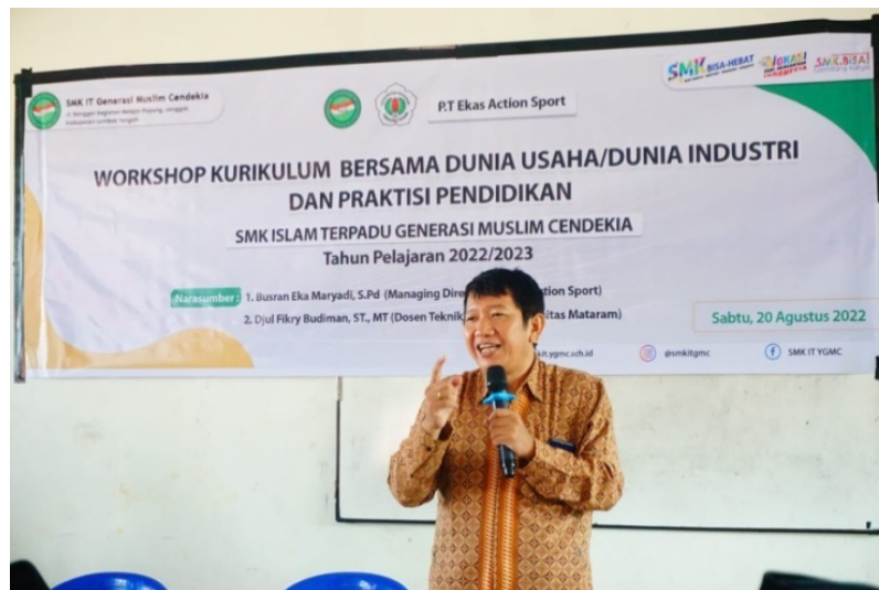
Gambar 1. Pemaparan Teknologi Masa depan 5G dan 6G

Dalam kegiatan Pengabdian pada Masyarakat dilakukan pada Hari Sabtu, Tanggal 20 Agustus 2022 langsung pada SMK ISLAM TERPADU Generasi Muslim Cendekia . Pelaksanaan diawali dengan workshop yang bertema :” Workshop Kurikulum Dunia Usaha/Dunia Industri dan Praktisi Pendidikan “