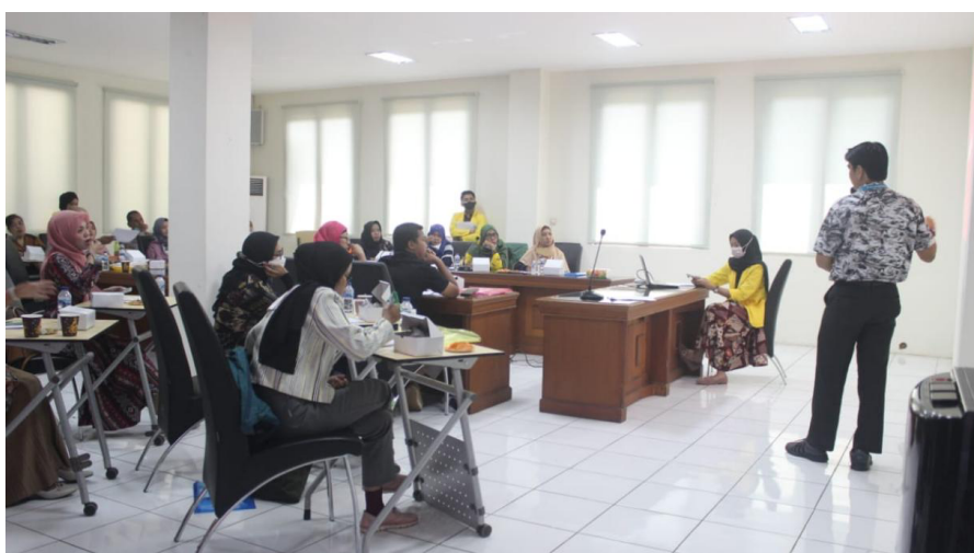
Gambar 2 : Tutorial Penyusunan Laporan Keuangan Dengan Accurate Lite

Kegiatan selanjutnya, peserta pelatihan diberi keterampilan berupa tutorial dan praktik langsung bagaimana mencatat transaksi dan menyusun laporan keuangan dengan menggunakan aplikasi Accurate Lite. Sebelumnya, setiap peserta pelatihan terlebih dahulu harus menginstal aplikasi Accurate Lite dari playstore menggunakan handphonenya masing-masing. Setelah Accurate Lite terinstal dalam gawai masing-masing peserta, selanjutnya diberikan suatu kasus akuntansi untuk diselesaikan dengan menggunakan Accurate Lite. Kasus ini sudah terdapat dalam modul yang dibagikan kepada tiap peserta. Dalam modul juga dilengkapi instruksi kerja untuk membantu peserta dalam praktik pembukuan. Dalam praktik pembukuan dan penyusunan laporan keuangan dengan Accurate Lite ini di pandu langsung oleh pemateri dengan bantuan LCD dan proyektor (Gambar 2). Selain itu juga peserta pelatihan didampingi dan dibantu oleh tim pelaksana seandainya peserta menemui kendala/hambatan dalam praktik.