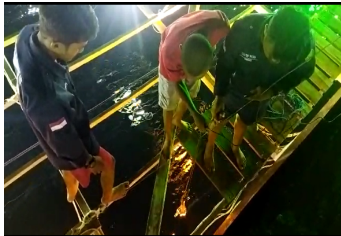
Gambar 4. Proses penurunan UFLPlus ke dalam laut dari atas bagan

Cara pengoperasian UFLPlus cukup dengan menyalakan lampu UFLPlus yang disambungkan dengan kabel listrik sepanjang 10 m pada sumber listrik. Sumber listrik yang digunakan dapat berupa aki (DC) maupun genset (AC) atau sumber listrik langsung. Kedalaman pengoperasian UFLPlus disesuaikan dengan kedalaman kantung jaring pada bagan perahu (Sudirman & Nessa, 2011). Setelah lampu menyala lalu secara perlahan dari atas bagan diturunkan ke dalam perairan, sebagaimana pada Gambar 4. Lampu yang digunakan adalah lampu jenis LED. Shen & Huang (2012) menyatakan bahwa lampu LED merupakan jenis lampu yang paling efektif digunakan sebagai lampu celup dalam air karena tidak menghasilkan panas pada permukaan lampu pada saat menyala sehingga keberadaannya tidak mempengaruhi suhu dalam air. Teknologi UFLPlus mampu meningkatkan hasil tangkapan jauh lebih banyak dari pada pengoperasian alat tangkap bagan dengan menggunakan lampu permukaan. Hal tersebut sesuai dengan pernyataan Pajri (2013) bahwa Hasil dari beberapa percobaan, Lampu celup bawah air telah terbukti membuat hasil tangkapan nelayan lebih banyak 2-3 kali lipat dibanding dengan hanya menggunakan lampu permukaan. Hal ini tentu akan berdampak pada peningkatan pendapatan nelayan.