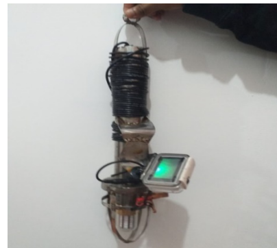
Gambar 3. Alat UFLPlus

Teknologi alat UFLPlus yang dirakit dan diterapkan kepada nelayan Desa Muara Tinobu, Kecamatan Lasolo adalah teknologi alat bantu penangkapan ikan dalam air yang mengacu pada hasil penelitian dan inovasi tim pengabdian kepada masyarakat ini sendiri yang bermula pada tahun 2017 dan terus mengalami pengembangan hingga tahun 2022 (Fajriah, 2022). Teknologi UFLPlus yang dikembangkan selain mampu menarik perhatian ikan dalam air dengan jangkauan yang dalam dan luas, juga memiliki desain yang mudah dibawa kemana-mana, tahan terhadap karat atau korosi dan sistem penggunaannya praktis sehingga mudah digunakan oleh berbagai kalangan. UFLplus sangat cocok digunakan oleh nelayan skala kecil karena biaya yang dibutuhkan cukup murah dibandingkan dengan hasil tangkapan dan manfaat yang akan diperoleh. Setelah pelatihan perakitan dilakukan, selanjutnya pada esok harinya dilakukan pendampingan penerapan UFLPlus di atas bagan atau pada lingkungan yang sebenarnya. Pada kegiatan pendampingan dilakukan uji coba pengoperasian sekaligus melihat dan menilai performa bekerjanya UFLPlus di lapangan.