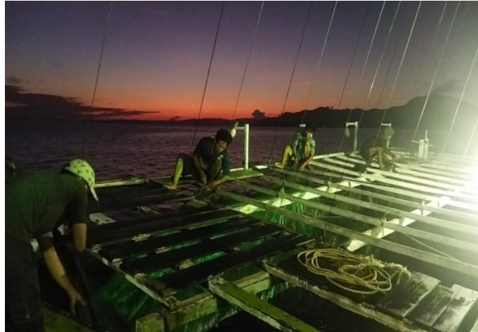
Gambar 1. Aktivitas Nelayan Bagan di Desa Muara Tinobu

Desa Muara Tinobu sebanyak 47 atau sekitar 75% dari total seluruh rumah tangga yang ada, dengan jumlah produksi mencapai 12.800 Kwintal per tahun. Nelayan di Desa Muara Tinobu adalah nelayan yang melakukan usaha penangkapan ikan menggunakan alat tangkap bagan sebagaimana pada Gambar 1, dengan target utama hasil tangkapan yaitu cumi-cumi, ikan teri, ikan tembang, dan golongan ikan pelagis kecil lainnya, yang selanjutnya dipasarkan dalam bentuk segar maupun diolah dengan cara pengeringan dan pengasapan. Kegiatan pengolahan ikan dengan cara pengeringan dan pengasapan juga dilakukan oleh nelayan di Kelurahan Molawe yang berbatasan dengan Desa Muara Tinobu, Kecamatan Lasolo (Fajriah, Padangaran, et al., 2020).