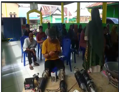
Gambar 2. Kegiatan Pelatihan penggunaan UFLPlus

(2) Cara Perakitan dan Petunjuk atau tata cara penggunaan UFLPlus, sebagaimana pada Gambar 2, setelah kegiatan penyuluhan dilaksanakan yang materinya dibawakan oleh tim pengabdian kepada masyarakat dan dibantu oleh tenaga penyuluh dari Dinas Kelautan dan Perikanan Kabupaten Konawe Utara, dilanjutkan dengan kegiatan tanya jawab segala hal terkait light fishing dan penggunaan teknologi UFLPlus. kegiatan selanjutnya adalah pelatihan perakitan UFLPlus dan menghasilkan 1 set alat UFLPlus sebagaimana pada Gambar 3.