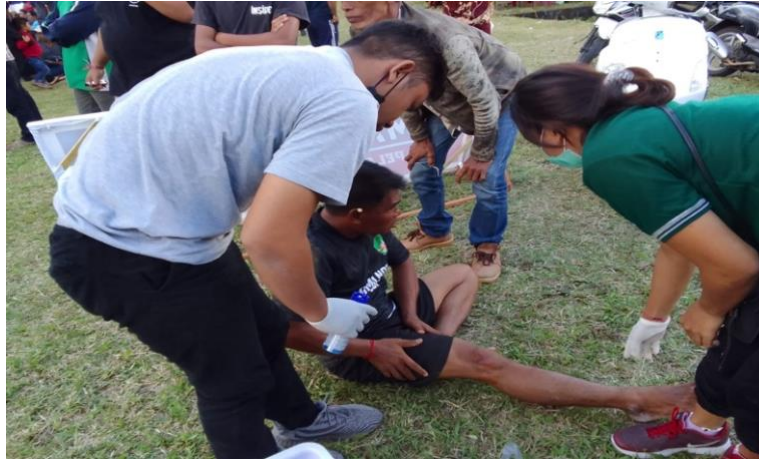
Gambar 4. Penanganan cedera

Dilihat dari penyebab cedera yang terjadi cedera disebabkan oleh gaya internal atau external sehingga diklasifikasikan sebagai direct atau indirect . Cedera langsung adalah hasil dari kekuatan eksternal yang berdampak pada seseorang. Cedera tidak langsung adalah akibat dari kekuatan internal di dalam tubuh, dan dapat disebabkan oleh teknik yang buruk, kurangnya kebugaran, atau sarana dan prasarana yang kurang memadai (Fahrizqi et al., 2021). Berdasarkan hasil dilapangan cedera yang terjadi dilihat dari penyebab cedera yang disebabkan oleh gaya internal individu, banyak pemain yang belum berpengalaman, kurangnya pemanasan, kontak fisik atau benturan antar pemain. Disisi lain juga diakibatkan oleh faktor eksternal, prasarana diama lapangan yang licin menyebabkan mudahnya pemain terpeleset atau tergelincir saat pertandingan yang dapat menyebabkan cedera pada pemain atau atlet yang sedang bertanding.