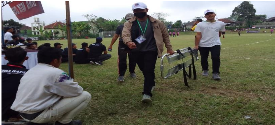
Gambar 3. Tim Fisioterapis pada saat Bertugas

data riwayat medis dan pemeriksaan gangguan gerak, keterbatasan fungsional, termasuk nyeri. Fisioterapis akan merencanakan prosedur fisioterapi berdasar kan hasil, prognosis dan kontraindikasi dan diagnosis fisioterapi, termasuk tujuan, dosis dan metode intervensi yang akan diberikan. Pada gambar 3 berikut menunjukan salah satu proses penanganan cedera oleh tim fisioterapi yang bertugas.