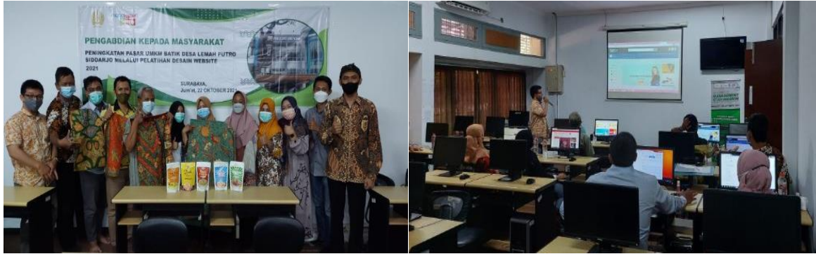
Gambar 3. Dokumentasi Kegiatan

Selanjutnya adalah tahap keempat monitoring dan evaluasi. Proses evaluasi akhir dapat dilakukan dengan memberikan tugas mandiri kepada peserta desain situs web untuk membuat situs web. Peserta yang melakukan proses pengerjaan tugas mandiri yang didampingi oleh instruktur. Bagi peserta yang mengalami kesulitan dalam menyelesaikan pekerjaannya dan membutuhkan semua bimbingan yang relevan, tugas mandiri dapat dikonsultasikan dengan pelatih. Hasil dari tugas mandiri ini dapat dijadikan acuan untuk memastikan bahwa peserta desain website telah memperoleh kemampuan yang diajarkan selama pelatihan..