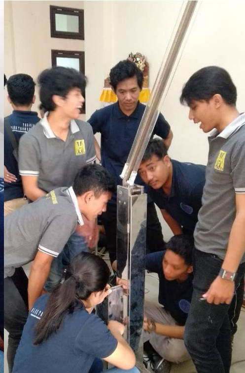
Gambar 3. Lampu UV