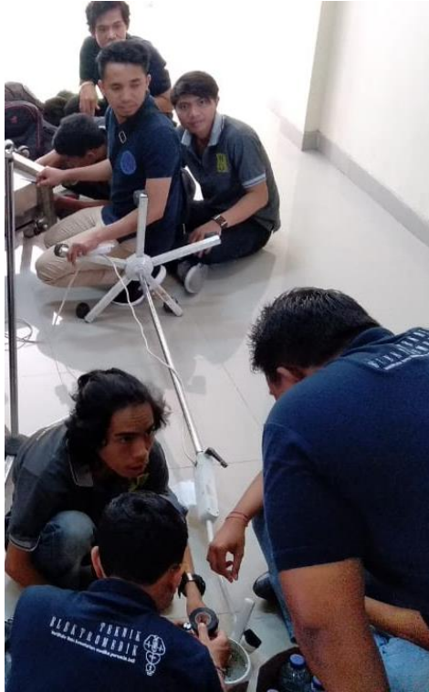
Gambar 2. Examination Lamp Provita