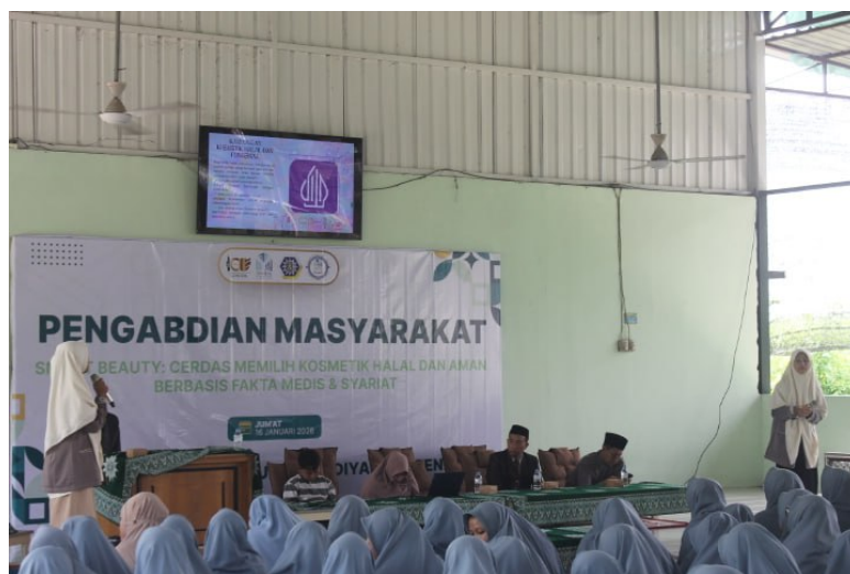
Gambar 1. Pemaparan Materi Mengenai Kosmetik Aman dan Halal

Persiapan kegiatan merupakan tahap awal yang sangat penting dalam pelaksanaan program pengabdian masyarakat ini. Tahapan ini mencakup beberapa Langkah strategis yang dilakukan secara sistematis. Langkah pertama adalah survei lapangan yang bertujuan untuk memahami kondisi awal serta gambaran umum pengetahuan siswa mengenai kosmetik aman dan halal. Selanjutnya, dilakukan pengurusan perizinan dan koordinasi dengan pihak sekolah guna menentukan jadwal pelaksanaan kegiatan agar sesuai dengan kalender akademik dan tidak mengganggu proses belajar mengajar.