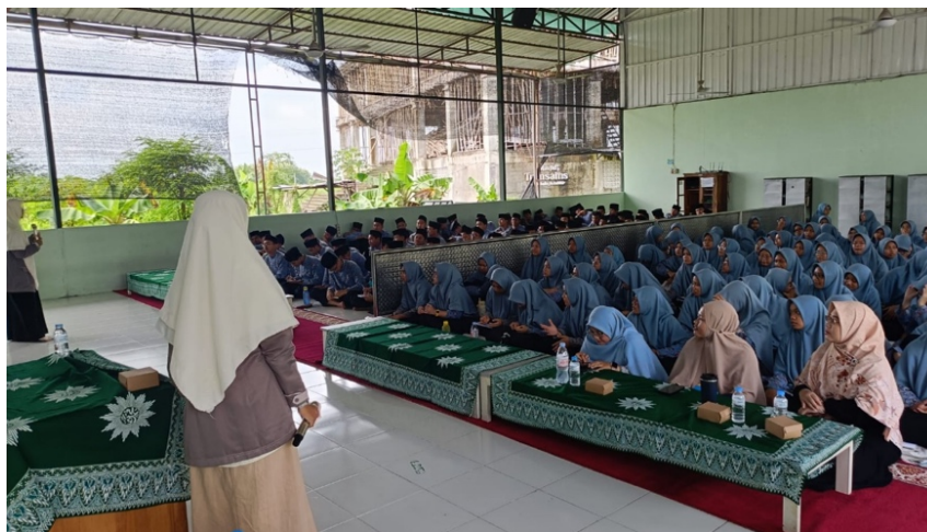
Gambar 2. Sosialisasi Bersama Siswa SMA Tresains Muhammadiyah Sragen

Tahap kedua adalah sosialisasi dan edukasi, yang dilakukan melalui metode ceramah dan diskusi interaktif dengan pendekatan partisipatif agar siswa lebih aktif dalam memahami materi. Penyampaian materi mencakup empat aspek utama yang disampaikan secara mendalam. Pertama, ciri-ciri kosmetik yang memiliki izin edar BPOM dan label halal resmi, tetapi juga diberikan contoh produk yang telah memiliki izin edar dan produk yang diragukan keamanannya untuk dibandingkan secara langsung.