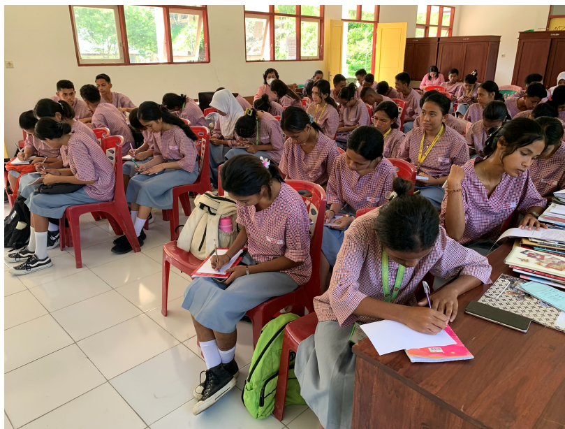
Gambar 2. Siswa sedang menjawab soal pre-test/post-test

Evaluasi kegiatan dilakukan dalam bentuk pre-test dan post-test. Pre-test dan post test diikuti 60 siswa dengan jumlah soal sebanyak 3. Soal yang diberikan sama untuk pre-test dan post-test. Soal pertama pertama terkait pengertian pencemaran, soal kedua jenis-jenis cemaran dan soal yang ketiga dampak dari pencemaran. Sebelum masuk dalam pemberian materi diberikan pre-test untuk mengetahui tentang pengetahuan awal dari siswa dan post-test diberikan setelah penyampaian materi untuk melihat perkembangan siswa terhadap materi yang sudah disampaikan.