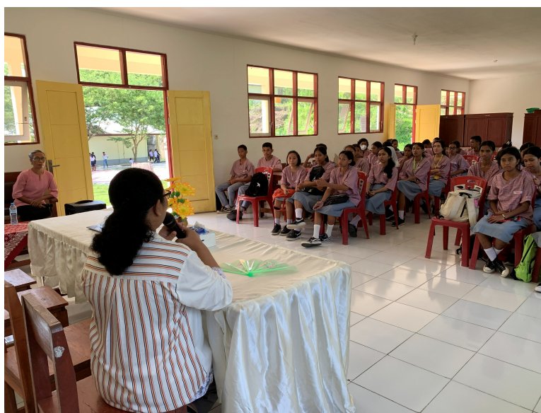
Gambar 1. Penyampaian materi

Maghfira, 2023). Berdasarkan karakteristiknya, pencemaran pesisir dapat diklasifikasikan ke dalam beberapa jenis utama, antara lain pencemaran kimia (seperti logam berat—merkuri, timbal, kadmium), pencemaran organik (limbah domestik, deterjen, dan nutrisi penyebab eutrofikasi), pencemaran fisik (sedimentasi dan sampah padat termasuk plastik dan mikroplastik), serta pencemaran biologis yang melibatkan mikroorganisme patogen (Belladonna, 2017; Afrilla & Puspikawati, 2021; Wijaya et al. , 2022; Santika, 2024). Sumber bahan pencemar ini sebagian besar berasal dari aktivitas daratan seperti limpasan sungai, pembuangan limbah rumah tangga dan industri, serta kegiatan pertanian, yang kemudian terakumulasi di wilayah pesisir sebagai zona peralihan yang rentan terhadap penumpukan polutan, selain juga berasal dari aktivitas laut seperti transportasi dan eksploitasi sumber daya. Pemahaman yang komprehensif mengenai konsep, jenis, dan sumber pencemaran ini menjadi sangat penting bagi siswa, khususnya pada jenjang SMA untuk menumbuhkan kesadaran dini akan pentingnya menjaga keberlanjutan ekosistem pesisir, sehingga pemahaman bahwa setiap tindakan kecil akan memberikan dampak kepada lingkungan khususnya ekosistem pesisir, termasuk pembuangan sampah ke pantai.