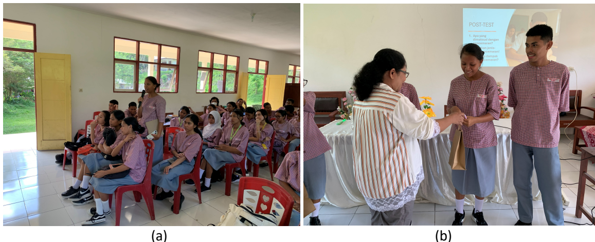
Gambar 4. (a) Siswa bertanya, (b) pemberian hadiah kepada siswa

Siswa diberikan kesempatan untuk bertanya dan berdiskusi terkait materi yang diberikan. Siswa cukup antusias dengan memberikan pemikiran kritis dan kepedulian yang tinggi untuk menjaga lingkungan pesisir dari kerusakan akibat pencemaran. Sebagai bentuk apresiasi, beberapa siswa diberikan hadiah karena aktif dalam kegiatan diskusi terkait pencemaran.