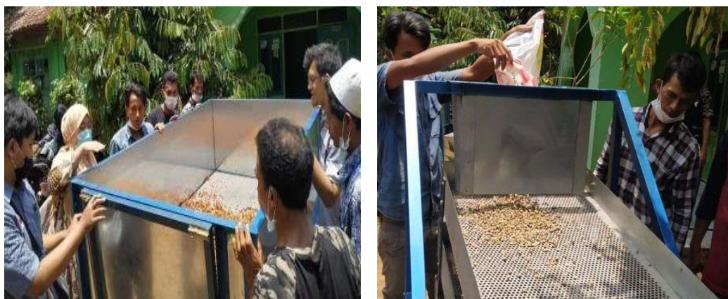
Gambar 4. (a) Proses pengeringan biji kopi (b) Proses sortasi biji kopi hijau kering

Tahap selanjutnya adalah pencucian (washing). Proses pencucian bertujuan untuk menghilangkan sisa-sisa lendir yang masih menempel pada kulit tanduk (Tello et al., 2011). Bagian-bagian yang terapung berupa sisa-sisa lapisan lendir yang terlepas dibuang, dan biji yang sudah bersih kemudian dikeringkan. Gambar 4 menunjukkan praktek pengeringan biji kopi dengan mesin pengering, sehingga waktu pengeringan lebih singkat dibandingkan pengeringan dengan sinar matahari. Setelah diperoleh biji kopi hijau kering maka dilanjutkan dengan sortasi untuk memisahkan biji kopi berdasarkan ukuran dan juga dari cacat biji. Proses sortasi pada kegiatan pelatihan ini menggunakan mesin sortir. Mutu kopi selama sortasi menentukan kualitas mutu akhir biji green coffee yang dihasilkan.