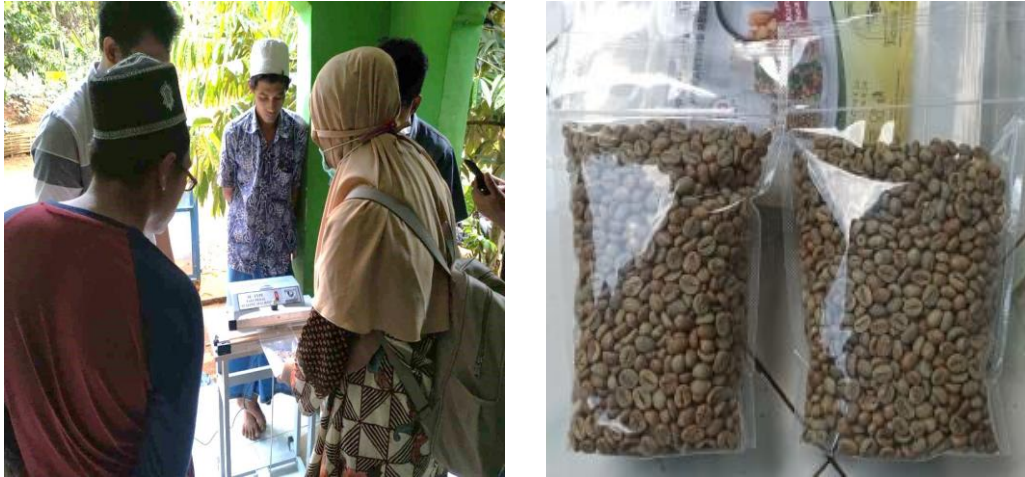
Gambar 5. (a) Praktek pengemasan menggunakan mesin sealer; (b) Produk green coffee