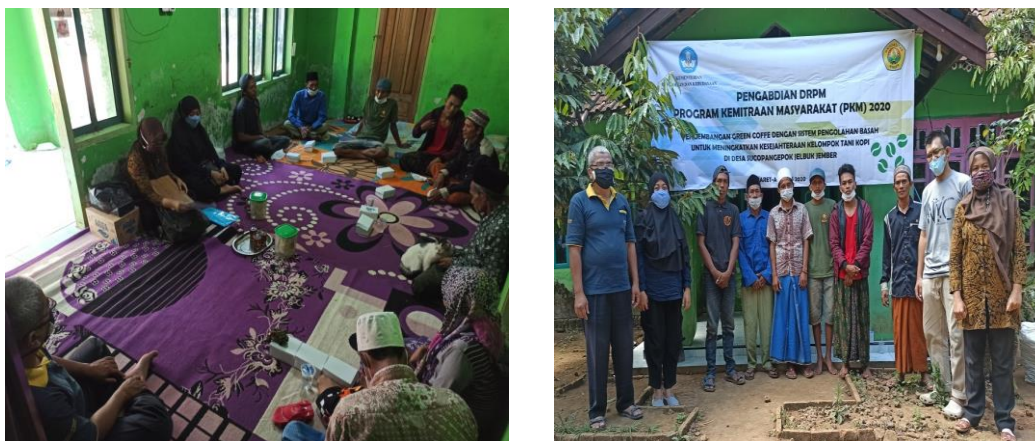
Gambar 1. Kegiatan Persiapan dan Sosialisasi