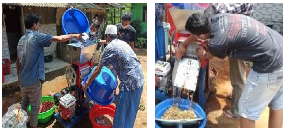
Gambar 3. Proses pulping buah kopi dengan mesin pulper

Tahap selanjutnya adalah pencucian (washing). Proses pencucian bertujuan untuk menghilangkan sisa-sisa lendir yang masih menempel pada kulit tanduk (Tello et al., 2011). Bagian-bagian yang terapung berupa sisa-sisa lapisan lendir yang terlepas dibuang, dan biji yang sudah bersih kemudian dikeringkan. Gambar 4 menunjukkan praktek pengeringan biji kopi dengan mesin pengering, sehingga waktu pengeringan lebih singkat dibandingkan pengeringan dengan sinar matahari. Setelah diperoleh biji kopi hijau kering maka dilanjutkan dengan sortasi untuk memisahkan biji kopi berdasarkan ukuran dan juga dari cacat biji. Proses sortasi pada kegiatan pelatihan ini menggunakan mesin sortir. Mutu kopi selama sortasi menentukan kualitas mutu akhir biji green coffee yang dihasilkan.