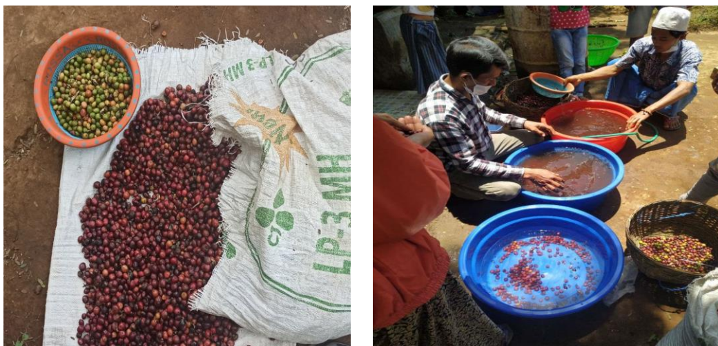
Gambar 2. Proses sortasi dan perambangan buah kopi secara manual

Pada tahapan ini dilakukan pelatihan dan pendampingan ke mitra mengenai proses pengolahan pasca panen kopi dengan metode basah. Selama ini mitra langsung menjual hasil panen kopi ke tengkulak tanpa melakukan proses penanganan terlebih dahulu, dan yang diketahui mitra hanya teknik penanganan pasca panen secara langsung yaitu menjemur kopi hasil panen dengan sinar matahari langsung. Teknik ini dikenal dengan teknik pengolahan kering. Teknik pengolahan kopi selain teknik kering adalah teknik semi basah dan teknik pengolahan basah. Pengolahan kopi basah menghasilkan biji kopi dengan mutu lebih baik, hanya saja memakan waktu lebih lama dibanding pengolahan kering. Pengolahan basah dapat dilakukan untuk skala kecil (tingkat petani) maupun menengah (semi mekanis dan mekanis).