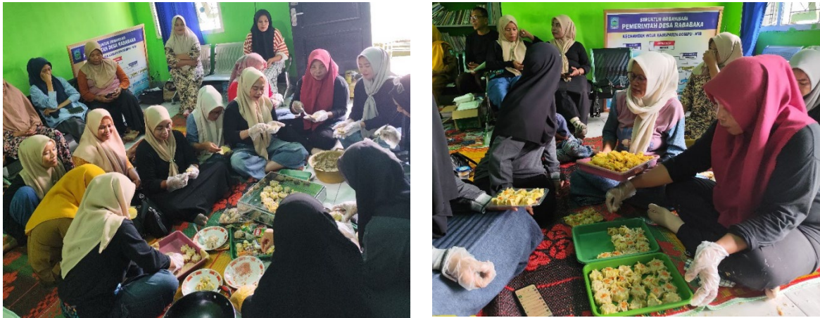
Gambar 1. Pelatihan Membuat Produk Olahan Ikan Air Tawar