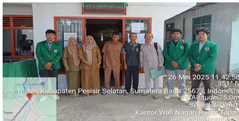
Gambar 1. Dokumentasi Tim Pengusul bersama Wali Nagari Pasar Tapan

Berdasarkan hasil observasi tim pengabdian Universitas Andalas ke Nagari Pasar Tapan dalam rangka Survei awal lokasi KKN, terlihat potensi UMKM sejatinya menjadi kekuatan lokal yang mampu menggerakkan perekonomian desa. Namun demikian, hasil observasi dan diskusi langsung dengan Penjabat (PJ) Wali Nagari Pasar Tapan menunjukkan bahwa potensi tersebut belum dikelola secara optimal. Salah satu tantangan utama yang dihadapi oleh pemerintah nagari adalah belum adanya sistem pendataan dan pemetaan UMKM yang komprehensif, serta belum maksimalnya peran Badan Usaha Milik Nagari (BUMNag) sebagai penggerak roda ekonomi desa. Data permasalahan di atas diperoleh tim pengusul pada tahap awal yang telah dilakukan berupa direct interview (26/5/2025) dan pengikatan kerja sama mitra (Gambar 1).