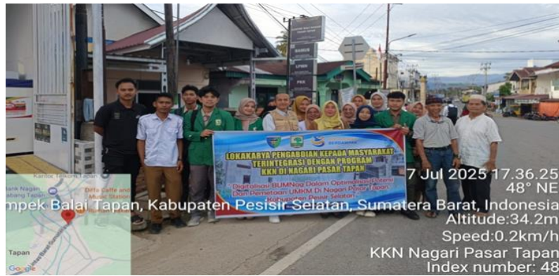
Gambar 3. Lokakarya Pemetaan Potensi UMKM Nagari

Tahapan kegiatan pengabdian ini terbagi dalam 3 tahap dimulai dengan observasi dan pemetaan potensi nagari, serta koordinasi intensif dengan Penjabat Wali Nagari, Sekretaris Nagari, dan pengurus BUMNag. Berdasarkan hasil observasi, diketahui bahwa Nagari Pasar Tapan memiliki 52 unit UMKM aktif yang sebagian besar bergerak di sektor kuliner, jasa, dan kerajinan rumah tangga. Data tersebut dikumpulkan melalui survei lapangan dan wawancara langsung oleh mahasiswa KKN bersama perangkat nagari, mengerucut menjadi 17 UMKM Unggulan yang dapat dilihat pada gambar 4. Lokasi Nagari Pasar Tapan yang berada di simpul strategis jalur lintas Sumatera menjadikannya kawasan dengan aktivitas ekonomi tinggi, namun potensi ini belum diikuti dengan pengelolaan data dan sistem digital yang memadai.