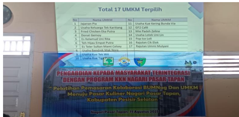
Gambar 4. Data UMKM Unggulan Nagari Pasar Tapan

Tahapan kegiatan pengabdian ini terbagi dalam 3 tahap dimulai dengan observasi dan pemetaan potensi nagari, serta koordinasi intensif dengan Penjabat Wali Nagari, Sekretaris Nagari, dan pengurus BUMNag. Berdasarkan hasil observasi, diketahui bahwa Nagari Pasar Tapan memiliki 52 unit UMKM aktif yang sebagian besar bergerak di sektor kuliner, jasa, dan kerajinan rumah tangga. Data tersebut dikumpulkan melalui survei lapangan dan wawancara langsung oleh mahasiswa KKN bersama perangkat nagari, mengerucut menjadi 17 UMKM Unggulan yang dapat dilihat pada gambar 4. Lokasi Nagari Pasar Tapan yang berada di simpul strategis jalur lintas Sumatera menjadikannya kawasan dengan aktivitas ekonomi tinggi, namun potensi ini belum diikuti dengan pengelolaan data dan sistem digital yang memadai.