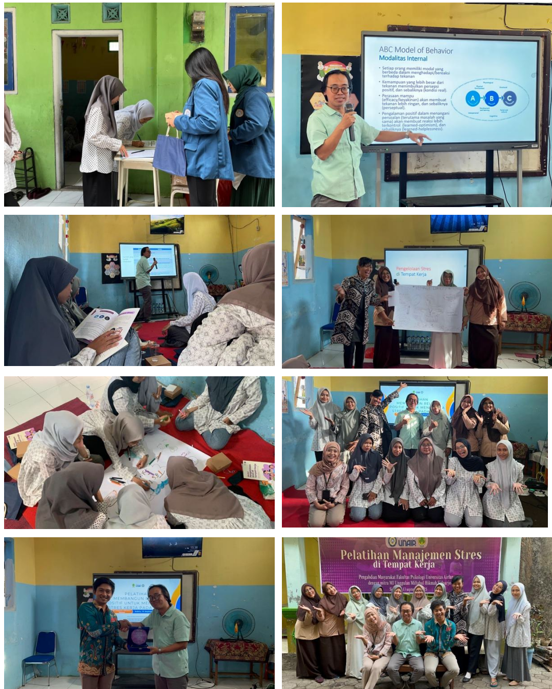
Gambar 2. Kegiatan Pelatihan

Mentoring dilakukan sebagai tindak lanjut dari kegiatan pelatihan yang bertujuan untuk memfasilitasi guru untuk melaporkan kemajuan atau mencari bantuan dan umpan balik jika ada kesulitan. Proses pendampingan dilakukan dengan melakukan pengamatan guru ketika mengajar atau menghadapi siswa dan saat menjalankan aktivitas di kantor bersama rekan kerja. Selain itu, dilakukan pula sesi berbagi ( sharing session ), agar para guru bisa saling menceritakan keluhan kesah dan praktik terbaik yang sudah dilakukan, terutama dalam mengatasi tekanan kerja. Mentoring juga berfungsi untuk melakukan evaluasi atas kemajuan kemampuan para guru dalam mengelola stres.