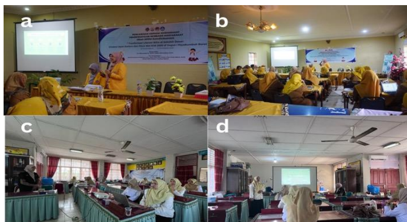
Gambar 1. Pelatihan Aspek Manajerial Guru (a. Dasar-dasar Literasi Iklim dan Perubahan Iklim), (b. Strategi Pembelajaran Kontekstual Berbasis Lingkungan), (c. Penyusunan RPP Literasi Iklim), (d. Presentasi RPP).

Setelah kegiatan workshop, para guru melanjutkan dengan penyusunan Rencana Pelaksanaan Pembelajaran (RPP) yang mengintegrasikan isu Jejak Karbon, FOLU Net Sink, dan perubahan iklim ke dalam kegiatan belajar mengajar. Proses penyusunan RPP dilakukan secara kolaboratif, kemudian setiap guru mempresentasikan hasil rancangan mereka di hadapan peserta lain dan fasilitator. Pada sesi ini, masing-masing rancangan memperoleh evaluasi dan masukan konstruktif, sehingga menghasilkan RPP final yang inovatif, kontekstual, serta mendukung penerapan pembelajaran berbasis lingkungan di sekolah.