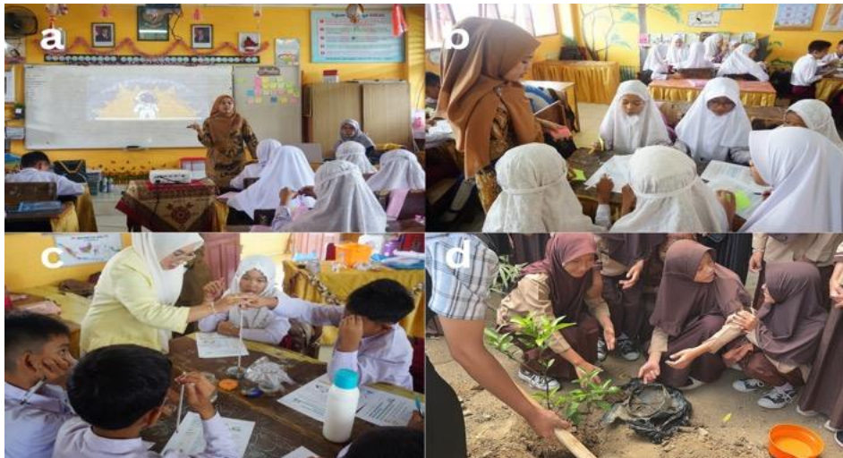
Gambar 2. Penerapan Teknologi dan Inovasi bagi siswa (a. Edukasi jejak karbon dan FOLU Net Sink), (b. Hitung Jejak Karbon Sendiri), (c. Eksperimen Efek Rumah Kaca Menggunakan Toolkit Edukatif), (d. Penanaman Bibit Pohon Sebagai Bentuk Aksi Nyata).

penutup dari rangkaian kegiatan pembelajaran, dilakukan penanaman bibit pohon sebagai bentuk aksi nyata mitigasi perubahan iklim. Aktivitas ini tidak hanya menjadi simbol komitmen terhadap pelestarian lingkungan, tetapi juga memberikan pengalaman langsung kepada siswa mengenai pentingnya vegetasi dalam menyerap karbon dioksida dan menjaga keseimbangan ekosistem. Melalui kegiatan ini, nilai tanggung jawab, kepedulian, dan partisipasi aktif terhadap lingkungan ditanamkan secara langsung kepada peserta didik.