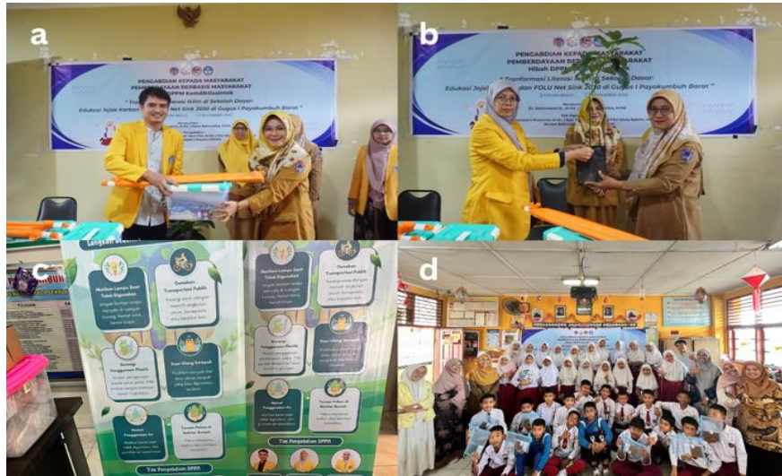
Gambar 4. Keberlanjutan Program (a. Penyerahan Toolkit), (b. Penyerahan Bibit), (c. Media Edukasi Visual), (d. Foto Bersama).