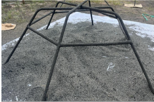
Gambar 5. Alat Peraga Media Transplantasi Terumbu Karang