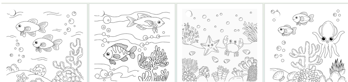
Gambar 2. Media Edukasi Interaktif