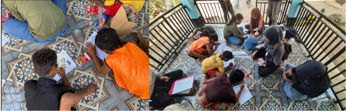
Gambar 3. Proses Mewarnai Biota Laut Didampingi oleh Mahasiswa

Kegiatan partisipatif dilakukan melalui aktivitas mewarnai gambar biota laut yang bertujuan untuk meningkatkan pemahaman visual sekaligus menumbuhkan ketertarikan peserta terhadap ekosistem terumbu karang. Selama kegiatan berlangsung, peserta didampingi oleh mahasiswa untuk memberikan arahan serta membantu mengaitkan gambar dengan materi yang telah disampaikan. Dokumentasi kegiatan tersebut dapat dilihat pada Gambar 3.