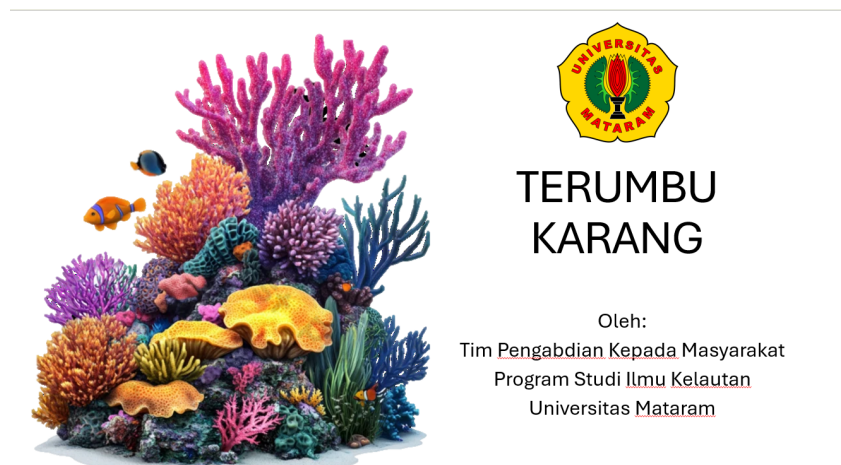
Gambar 1. Materi Presentasi