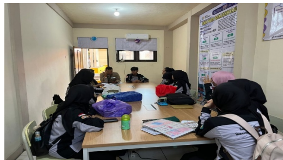
Gambar 1. Briefing dengan Guru SMKN PGRI Banjarbaru

Kegiatan ini dijalankan dengan waktu pelaksanaan selama kurang lebih 60 menit, dengan rincian sebagai berikut: 5 menit untuk briefing dan persiapan sebagaimana yang disajikan pada Gambar 1, 20 menit untuk sesi pembukaan dan pengerjaan pre-test sebagaimana yang disajikan pada Gambar 2, 15 menit untuk sesi pemberian materi sebagaimana yang disajikan pada Gambar 3, 10 menit untuk diskusi dan tanya jawab sebagaimana yang disajikan pada Gambar 4, serta 10 menit untuk penutupan, pengerjaan post-test sebagaimana yang disajikan pada gambar 5, dokumentasi, dan salam penutup. Dokumentasi kegiatan dilakukan dalam bentuk foto, sebagai bagian dari laporan kegiatan sebagaimana yang disajikan pada Gambar 6.