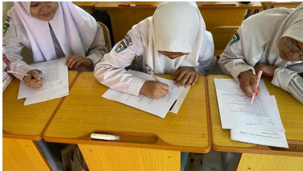
Gambar 5. Pengerjaan Post-test