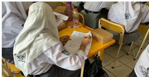
Gambar 2. Pengerjaan Pre-test