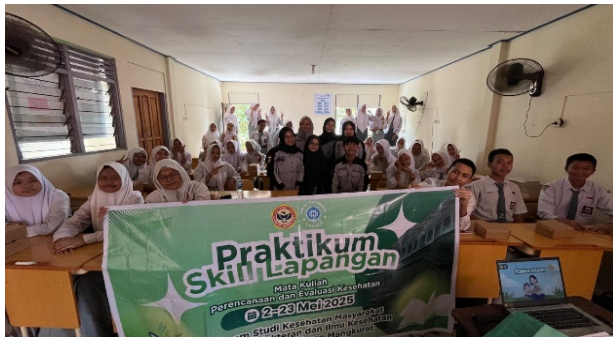
Gambar 6. Dokumentasi Kegiatan

Melalui metode ceramah interaktif dan diskusi partisipatif yang dilengkapi dengan evaluasi awal dan akhir ( pre-test dan post-test ), diharapkan kegiatan pengabdian masyarakat ini dapat memberikan dampak positif secara nyata terhadap peningkatan pengetahuan dan kesadaran peserta mengenai risiko seks pranikah. Lebih jauh, kegiatan ini juga diharapkan mampu menjadi kontribusi nyata dalam upaya promotif dan preventif terhadap masalah kesehatan reproduksi remaja yang semakin kompleks di era modern.