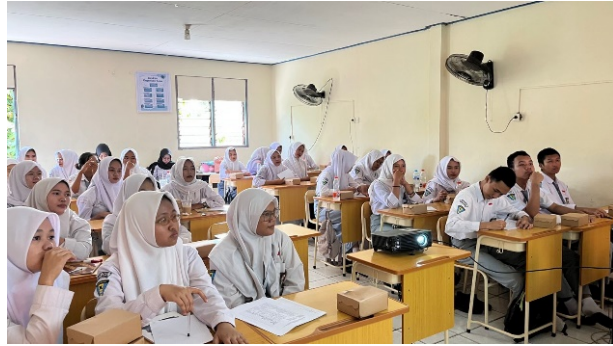
Gambar 4. Sesi Diskusi dengan Pemateri