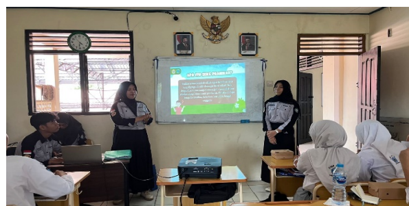
Gambar 3. Sesi Penyampaian Materi