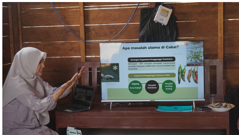
Gambar 1. Proses Edukasi TREAT METHOD menggunakan media proyeksi

Tahap edukasi menjadi tahap awal kegiatan ini sebagai dasar pengetahuan kegiatan yang akan dilakukan selanjutnya. Pengetahuan yang disampaikan mengenai pemahaman pengendalian hama terpadu dan implementasi di lahan budidaya. Prinsip pengendalian hama terpadu yaitu melakukan pengendalian hama dan patogen tanaman dengan dua atau lebih teknik pengendalian. Teknik pengendalian antara lain regulasi, teknik fisik, mekanik, kultur teknis, biologi dan kimia. TREAT METHOD merupakan serangkaian teknik pengendalian terpadu yang akan diimplementasikan pada lahan demplot cabai di KWT anyelir. TREAT METHOD merupakan teknik pengendalian hayati dengan Trichoderma harzianum (TRICHONELA), penanaman Refugia dan penggunaan pestisida nabati yang berbahan tembakau pada pemeliharaan tanaman.