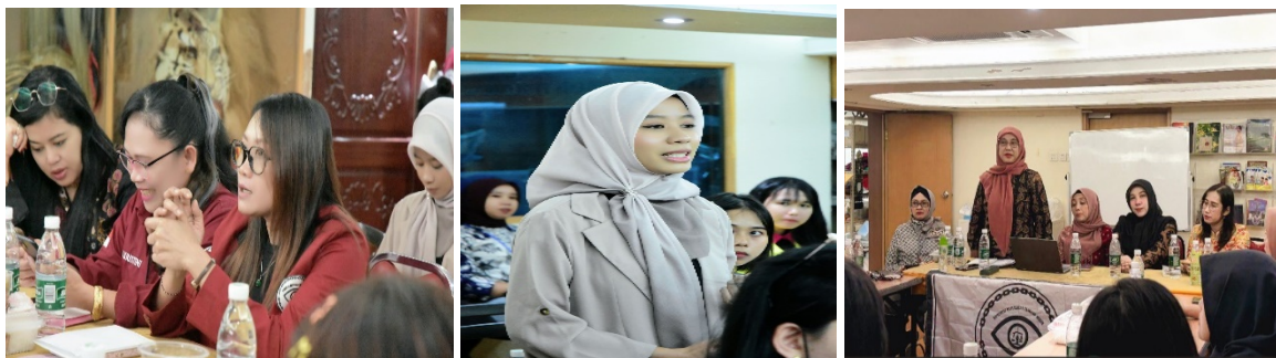
Gambar 2. Pelaksanaan Kegiatan Pengabdian Internasional