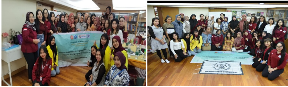
Gambar 3. Dokumentasi Tim dan Peserta pengabdian internasional