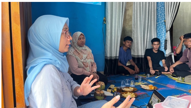
Gambar 1. Kegiatan penyuluhan yang dilakukan tim penyuluh pada kelompok tani Setia Bakti.

Kegiatan ini juga berkontribusi dalam memperluas pemahaman peserta mengenai konsep pengendalian hama berbasis ekologi, termasuk pentingnya mengoptimalkan peran musuh alami dalam menekan populasi organisme pengganggu tanaman. Selain itu, peserta memperoleh wawasan mengenai dampak penggunaan pestisida kimia yang berlebihan, seperti munculnya resistensi hama serta potensi risiko terhadap kesehatan manusia dan kualitas lingkungan. Peningkatan tingkat pemahaman peserta tercermin dari hasil evaluasi pascakegiatan, di mana nilai post-test menunjukkan kenaikan sebesar 76,8% dibandingkan dengan hasil pre-test (Gambar 2).