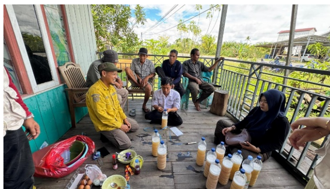
Gambar 2. Proses Pembuatan pupuk organik cair Photosynthetic Bacterial (PSB)