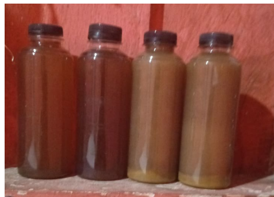
Gambar 4. Pupuk organik cair Photosynthetic Bacterial (PSB) yang sudah terinkubasi selama 14 hari lebih.