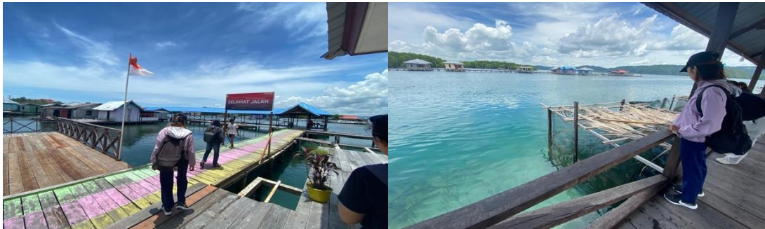
Gambar 2. Survei Lokasi

untuk mengetahui potensi apa saja yang ditemui di lokasi khususnya di Kampung Enggros, serta permasalahan yang dihadapi oleh kelompok ibu-ibu yang dijadikan sebagai mitra dalam kegiatan pengabdian ini. Apabila ingin menjalankan kegiatan PKM (Pengabdian Kemitraan Masyarakat), maka harus menganalisis lokasi untuk memainkan peran krusial untuk memastikan keberhasilan dan dampak yang optimal [17]. Hal ini dilakukan sebagai solusi untuk membantu kelompok mitra dalam permasalahan yang terjadi dalam mengembangkan potensi wisata secara digital di Kampung Enggros.