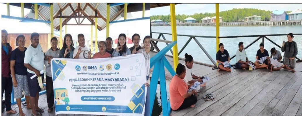
Gambar 3. Sosialisasi tentang Ekonomi Kreatif

Sosialisasi merupakan pola perilaku dalam lingkungan yang harus menjadi wadah yang baik bagi masyarakat terhadap perkembangan dan pengembangan informasi [17]. Lingkungan sebagai faktor eksternal yang memegang peran untuk memberikan kontribusi dalam hal pengalaman dan pendidikan yang dibutuhkan oleh sekelompok masyarakat [18]. Masyarakat yang sekarang diberikan materi tentang ekonomi kreatif yaitu Kelompok Kreativitas Moogarda yang menjadi mitra dan audience (pendengar) pada kegiatan pengabdian ini (Gambar 3). Materi yang disampaikan memuat potensi yang dimiliki oleh masyarakat kampung Enggros yaitu komoditi ikan Belanak ( Moogrado sp. ), di mana sisik ikan yang dianggap limbah dapat dijadikan sebagai asesoris berupa kalung, anting, cincin, jepitan rambut dan gantungan kunci. Limbah sisik ini dapat membuka lapangan pekerjaan kepada kelompok mitra dalam mengembangkan usaha serta memperoleh pendapatan. Hal ini perlu dikembangkan oleh Kelompok Kreativitas Moogarda yang berjumlah 10 orang, sehingga potensi wisata yang dimiliki dengan panorama alamnya yang indah dilengkapi dengan asesoris yang dijadikan souvenir khas Kampus Enggros.