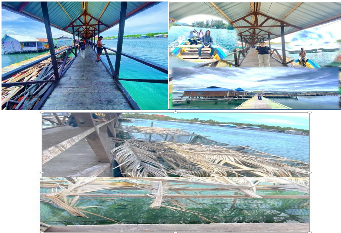
Gambar 1. Potensi Wisata Kampung Enggros (a.Mancing; b.Foto; c.Budidaya ikan)

Sekarang ini dari pihak Pemerintah sementara membina masyarakat untuk dapat meningkatkan kreativitasnya dalam mengelola kampung Enggros menjadi kampung wisata untuk menarik wisatawan domestik dan mancanegara [2]. Pembinaan yang dilakukan yaitu Pemerintah bersama masyarakat menjalankan program kebersihan kampung, pengelolaan sampah, dan pelestarian mangrove serta laut agar lingkungan tetap terjaga dan wisata berkelanjutan. Dalam rangka meningkatkan peluang pengembangan potensi wisata di Kampung Enggros tentunya diperlukan gerakan untuk melakukan perubahan yang harus dimulai dari sejauh mana pemahaman akan manfaat potensi tersebut pada masyarakat lokal sendiri [3].