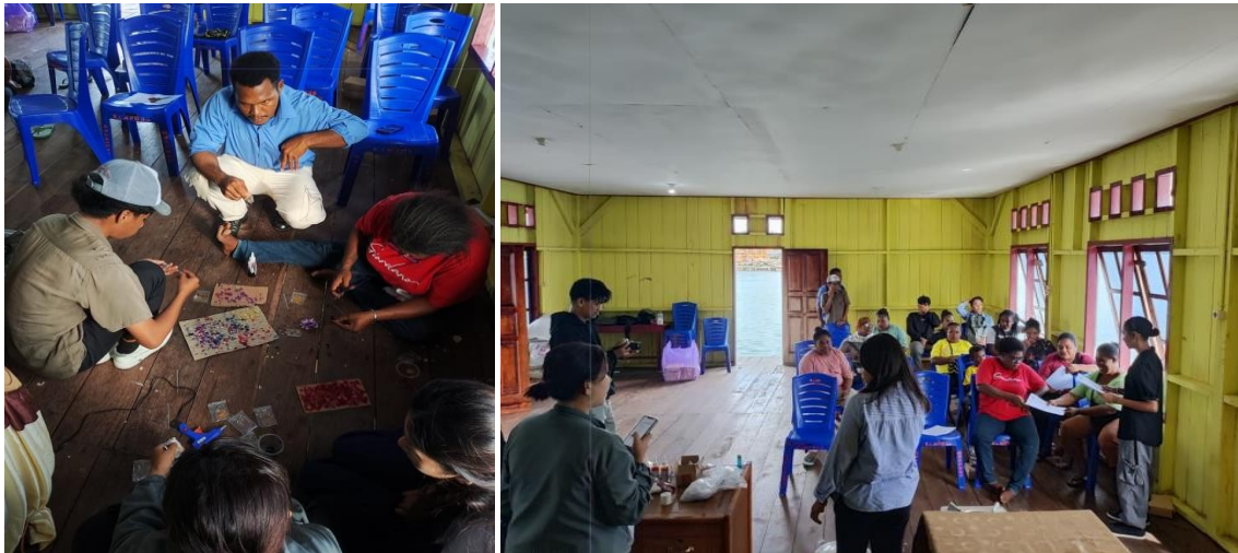
Gambar 4. Mengajarkan Cara Membuat Asesoris kepada Mitra

membuat beberapa souvenir kepada kelompok mitra (Kelompok Kreativitas Moogarda) dengan bahan dasarnya sisik ikan belanak (Gambar 4). Mitra (Kelompok Kreativitas Moogarda) sangat antusias mengikuti pelaksanaan kegiatan ini dengan membuat anting, kalung, cincin, jepitan rambut dan gantungan kunci (Gambar 5).