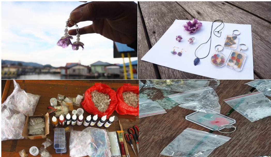
Gambar 5. Kerajinan Sisik Ikan