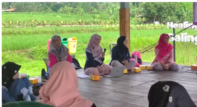
Gambar 2. Pelatihan sesi 1 mengenai persiapan sertifikasi halal

Produk yang telah mendapatkan sertifikasi halal lebih mudah diterima dan dipercaya oleh konsumen, sehingga dapat meningkatkan pangsa pasar dan loyalitas pelanggan. Sertifikasi halal tidak hanya memberikan jaminan kepada konsumen bahwa produk tersebut sesuai dengan syariat Islam, tetapi juga meningkatkan citra dan reputasi usaha. Tantangan utama dalam implementasi sistem jaminan halal meliputi keterbatasan sumber daya, kurangnya pengetahuan dan biaya yang tinggi. Oleh karena itu, pelatihan dan edukasi mengenai prinsip-prinsip halal serta cara praktis untuk memenuhi persyaratan sertifikasi sangat penting bagi UMKM (Yusuf, 2024).