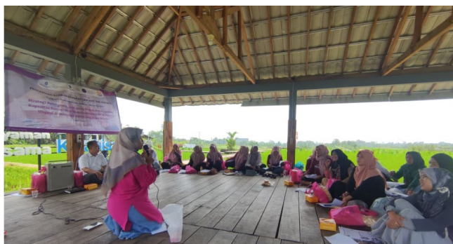
Gambar 3. Pelatihan sesi 2 mengenai izin edar produk pangan

Pemaparan materi pada pelatihan sesi kedua berfokus pada prosedur pengajuan izin edar, dengan penekanan khusus pada Sertifikat Produksi Pangan Industri Rumah Tangga (SPP-IRT). Pada sesi ini, peserta diberikan pemahaman tentang prosedur administratif, persyaratan yang harus dipenuhi, serta ketentuan pelabelan pada kemasan produk sesuai regulasi yang berlaku. Materi disampaikan dengan pendekatan partisipatif dan aplikatif, sehingga setiap peserta mengikuti kegiatan secara aktif, antusias, dan menunjukkan minat tinggi untuk menerapkan pengurusan izin edar SPP-IRT. Dokumentasi pemaparan materi dan sesi diskusi tahap 2 disajikan pada Gambar 3.