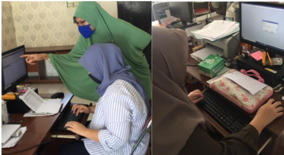
Gambar 1. Sesi tutorial dan praktik

Setelah itu, dilanjutkan dengan kegiatan praktik. Seperti yang telah dijelaskan sebelumnya bahwa pencatatan yang selama ini dilakukan oleh StafAkuntansi BPU hanya sebatas pencatatan manual yang diinput ke microfost Excel, di mana data Excelini yang dijadikan sebagai data laporan keuangan (pendapatan dan belanja). Kegiatan ini merupakan inti dari kegiatan pengabdian, karena sekaligus akan memproses transaksi keuangan baik pendapatan maupun belanja yang dilakukan oleh BPU ke dalam program AkuntansiAccurate. Penguiputan transaksi yang secara teknis meliputi transaksi pendapatan dan belanja yang masing-masing dipisahkan berdasarkan pos (sub akun dari pendapatan maupun belanja). Pendapatan yang diproses dibagi ke dalam sub akun pendapatan