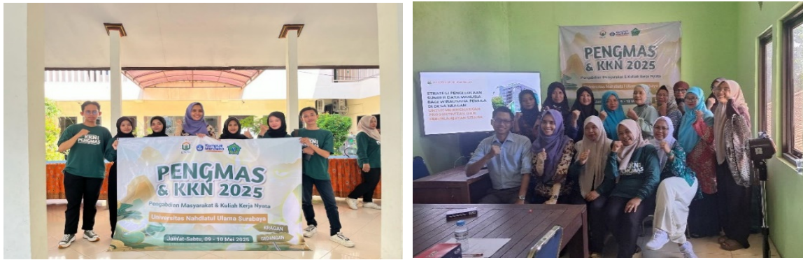
Gambar 1. (a) Tim Pengmas & KKN Unusa (b) Dosen Pembimbing Lapangan Pengmas & KKN dengan Masyarakat Desa Kragan