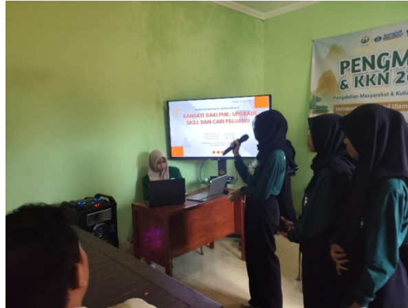
Gambar 3. Pelatihan SDM: Penyusunan CV dan Persiapan Wawancara Kerja

pemanfaatan sistem pre-order sebagai solusi atas keterbatasan modal. Pendekatan ini sekaligus menanamkan pola pikir kewirausahaan yang berani mencoba, kreatif, dan mampu membaca peluang, sehingga diharapkan mampu mendorong mereka untuk bangkit dari dampak PHK dan membangun kemandirian ekonomi secara berkelanjutan. Strategi ini memperkuat daya saing lokal sebagaimana ditunjukkan oleh penelitian Lubis, et al (2023), Nugroho & Wahyuni (2023), Treesje dan Imran (2025).