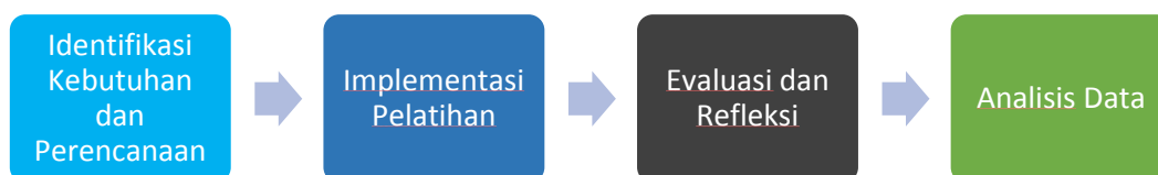
Gambar 1. Tahapan kegiatan

Kegiatan pengabdian masyarakat ini dilaksanakan di balai Desa Kragan pada tanggal 26 – 27 Mei 2025 dengan para peserta 1 aparat Kepala Desa, 10 ibu – ibu PKK, dan 4 orang Karang Taruna dengan total 15 peserta. Kegiatan ini dilakukan dengan menggunakan pendekatan Penelitian Tindakan Partisipatif (Participatory Action Research - PAR) . Pendekatan ini dipilih karena memungkinkan keterlibatan aktif dan kolaborasi antara tim pelaksana dan mitra di Desa Kragan (Chevalier & Buckles, 2013. Seperti yang ditunjukkan oleh (Tiasari et al. , 2024). PAR sangat efektif dalam memastikan bahwa program yang dirancang relevan dengan kebutuhan nyata masyarakat dan memberdayakan mereka untuk menjadi agen perubahan bagi diri mereka sendiri.