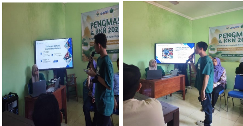
Gambar 3. (a),(b) Pelatihan Digital Marketing: Pembuatan Katalog Produk Menggunakan Canva

menunjukkan bahwa digital marketing efektif dalam mendukung pemulihan ekonomi pasca-krisis. Dengan demikian, pelatihan ini tidak hanya memberikan alat, tetapi juga membangun mentalitas kewirausahaan yang kuat sebagai pondasi ekonomi pasca-PHK.