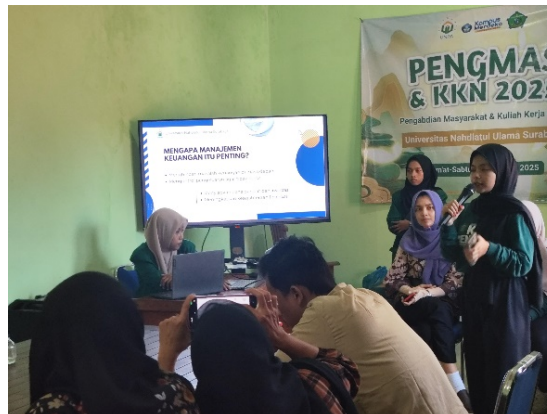
Gambar 2. Pelatihan Literasi Keuangan: Simulasi Pengelolaan Anggaran Keluarga

besar. Pada hari ke 2, sejumlah 7 orang ibu – ibu PKK dan 1 orang aparat Desa, meminta dipandu cara membuka akun investasi dan 6 orang berhasil membuka akun investasi instrument reksadana pasar uang pada platform investasi digital. Sedangkan para peserta Karang Taruna mulai berencana mengaktifkan kembali akun Tabungan mereka yang sempat dibiarkan tidak aktif selama beberapa waktu, mengingat syarat pendaftaran ke platform investasi digital membutuhkan akun Tabungan aktif. Dengan pelatihan ini, diharapkan peserta dapat membangun kesadaran akan pentingnya perencanaan keuangan, menghindari jebakan utang, serta mulai menerapkan praktik keuangan yang sehat menuju kemandirian finansial yang berkelanjutan. Pelatihan ini sejalan dengan Chen et al. (2024), Sharma (2023) Supriyanto & Handayani (2023), Farahiyah, & Haryadi,(2024) yang menekankan pentingnya literasi keuangan bagi keberlanjutan rumah tangga.