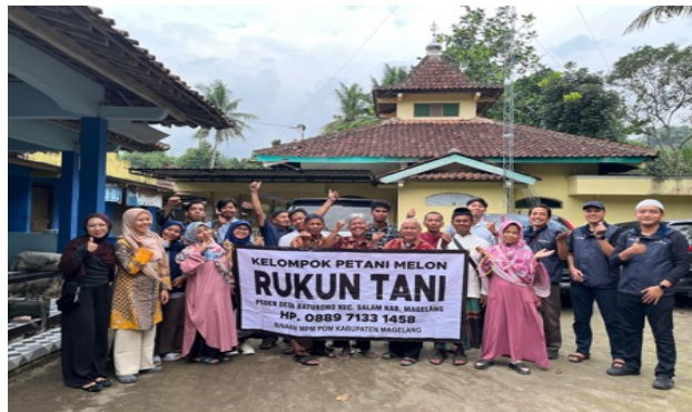
Gambar 1. Sosialisasi dan koordinasi dengan mitra Rukun Tani

Kegiatan sosialisasi dan koordinasi dengan mitra dilaksanakan pada tanggal 20 Juni 2025. Kegiatan sosialisasi program dan koordinasi dengan mitra dihadiri oleh ketua rukun tani, Ketua Pimpinan Cabang Muhammadiyah (PCM) Salam dan anggota rukun tani (Gambar 1).