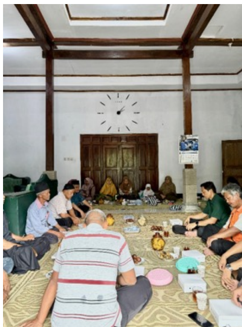
Gambar 2. Pelaksanaan pelatihan manajemen organisasi