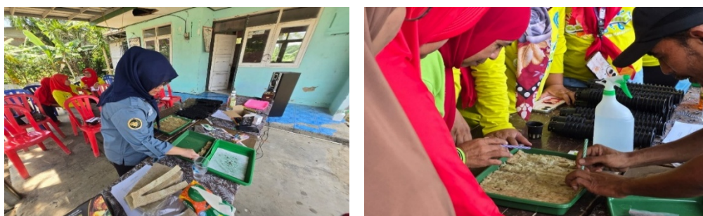
Gambar 3. Pelatihan teknologi hidroponik

Pengetahuan yang mumpuni harus didukung oleh ketersediaan pangan yang memadai dan beragam. Kegiatan kedua, yaitu pelatihan penanaman dengan metode hidroponik, dirancang untuk mengatasi masalah Pemberian Makanan Tambahan (PMT) untuk balita yang cenderung monoton dan belum bervariasi. Kader dilatih untuk membudidayakan berbagai produk pertanian kaya gizi di lahan terbatas di sekitar Posyandu. Pelatihan ini dilakukan secara sistematis, mulai dari pemetaan potensi pangan lokal, persiapan media tanam, hingga penguasaan teknik penanaman dan perawatan hidroponik. Kegiatan ini menghadirkan narasumber yang memiliki kompetensi dalam metode hidroponik.