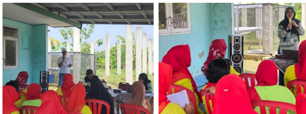
Gambar 2. Kegiatan edukasi gizi dan pelatihan pengolahan pangan lokal

Setelah pengetahuan kader meningkat dan bahan pangan bergizi tersedia, pilar Dapur Gizi yang berfokus pada pelatihan pemanfaatan pangan lokal. Pelatihan ini bertujuan untuk menghidupkan dan mengoptimalkan fungsi dapur di Posyandu sebagai pusat pengolahan makanan tambahan yang sehat dan lezat bagi balita. Kader tidak hanya diajarkan cara memasak, tetapi juga dibekali keterampilan dalam teknik panen yang benar, metode penyimpanan untuk menjaga kesegaran dan zat gizi, hingga praktik pengolahan menjadi berbagai produk makanan bergizi yang menarik bagi anak. Pada kegiatan ini para kader diberikan metode dan cara pengolahan beberapa pangan lokal seperti kangkung, bayam dan lain-lain yang dihasilkan pada tanaman hidroponik yang diterapkan.