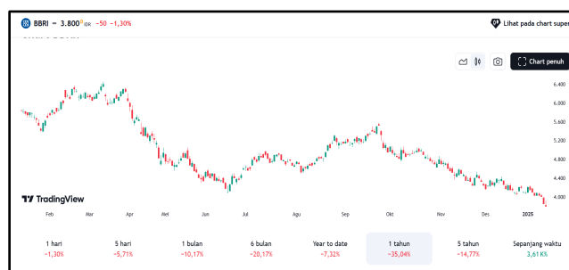
Gambar 1. Chart Candlestick Selama Satu Tahun Yang Digunakan Untuk Memprediksi Pergerakan Harga Saham Bagi Trader

Secara umum ada tiga cara menganalisa saham yakni Analisa teknikal, sentiment serta Analisa fundamental. Analisa teknikal biasanya dilakukan oleh para trader atau mereka yang melakukan trading saham. Analisa ini tidak dilakukan oleh para investor saham, karena Analisa teknikal ini mengalami perubahan yang sangat cepat, bisa dalam hitungan menit, lima menit, sepuluh menit, lima belas menit, tiga puluh menit, satu jam, satu hari, satu minggu dan satu tahun. Analisa teknikal ini juga lebih spekulatif dibandingkan dengan Analisa fundamental. Analisa teknikal ini sering juga tidak sesuai dengan kebiasaan dari indikator yang terjadi selama ini. Analisa teknikal ini menggunakan candlestick sebagai indikator pergerakan harga saham berikutnya.