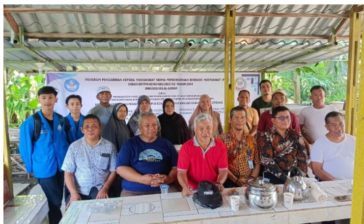
Gambar 3. Sosialisasi Prinsip Kerja Alat Simosti

Keterangan: * Nilainya lebih besar dari minimum atau lebih kecil dari maksimum