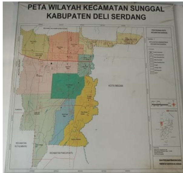
Gambar 1. Peta Wilayah Kecamatan Sunggal Kabupaten Deli Serdang

Hal lain yang melatarbelakangi kegiatan PKM ini adalah desa Sei Semayang memiliki potensi untuk aktivitas pertanian karena suhu udara rata-rata di antara 27°C - 30,0°C dan kelembaban udara rata-rata di antara 73,6% - 83,8% (Waruwu, 2023). Koptan Pondok Miri Asri memiliki beberapa kegiatan usaha, yaitu penyemaian bibit produktif seperti pohon buah matoa, mangga, dan simpur (Rauf et al. , 2022). Selain itu, juga terdapat kegiatan usaha pembuatan pupuk kompos dari kotoran hewan ternak dan sampah organik (Aidha & Ayu, 2022; Hanafi et al. , 2020). Kegiatan PKM ini hanya berfokus pada usaha pembuatan pupuk kompos. Gambar 2 adalah proses pembuatan pupuk kompos yang dilakukan oleh mitra pada tahapan sampah organik melalui mesin pencacah.