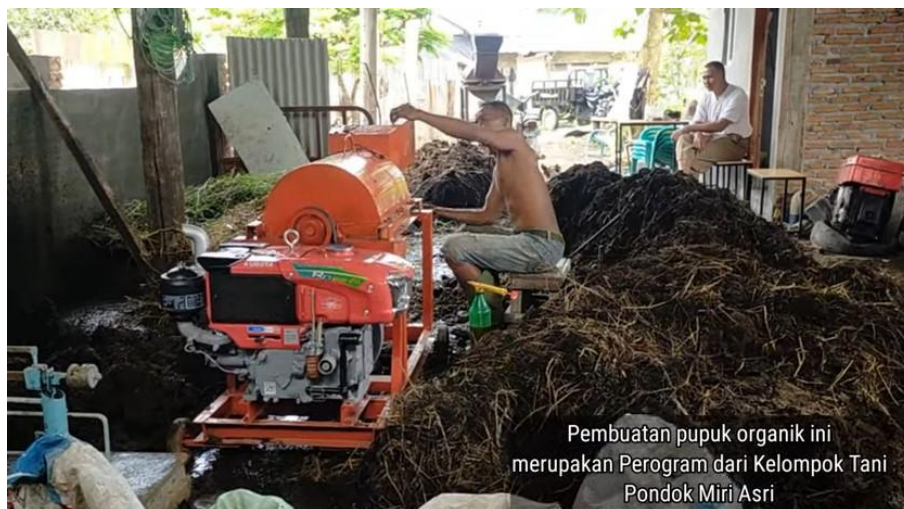
Gambar 2. Pembuatan Pupuk Kompos oleh Koptan Pondok Miri Asri

Hal lain yang melatarbelakangi kegiatan PKM ini adalah desa Sei Semayang memiliki potensi untuk aktivitas pertanian karena suhu udara rata-rata di antara 27°C - 30,0°C dan kelembaban udara rata-rata di antara 73,6% - 83,8% (Waruwu, 2023). Koptan Pondok Miri Asri memiliki beberapa kegiatan usaha, yaitu penyemaian bibit produktif seperti pohon buah matoa, mangga, dan simpur (Rauf et al. , 2022). Selain itu, juga terdapat kegiatan usaha pembuatan pupuk kompos dari kotoran hewan ternak dan sampah organik (Aidha & Ayu, 2022; Hanafi et al. , 2020). Kegiatan PKM ini hanya berfokus pada usaha pembuatan pupuk kompos. Gambar 2 adalah proses pembuatan pupuk kompos yang dilakukan oleh mitra pada tahapan sampah organik melalui mesin pencacah.