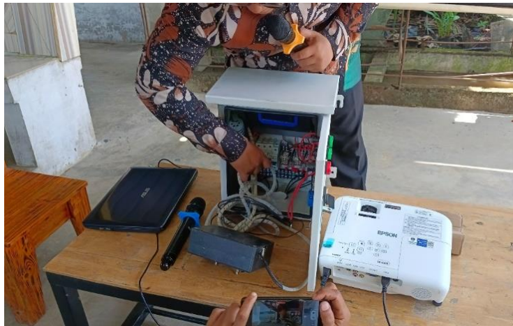
Gambar 4. Pelatihan Instalasi dan Perbaikan Sederhana Alat SIMOSTI

Tahapan berikutnya adalah dilakukan kegiatan sosialisasi dan pelatihan terkait sistem pengawasan kompos terintegrasi internet of things (Simosti) kepada mitra seperti pada Gambar 4. Pada tahap sosialisasi meliputi penjelasan alat Simosti yang berfungsi mengukur kualitas pupuk yang tersusun dari sensor Nitrogen (N), Fosfor (P), dan Kalium (K) yang telah terintegrasi dalam satu komponen. Selain itu, alat Simosti juga tersusun dari sebuah Prosesor ESP32, sebuah router, dan rangkaian daya.