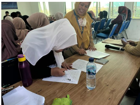
Gambar 3. Foto Peserta Melakukan Registrasi

Pembukaan acara dilakukan pada pukul 09.00 WIB. Namun sebelum itu dilakukan registrasi terlebih dahulu. Peserta yang hadir harus menuliskan nama mereka pada daftar hadir dan mengumpulkan berkas yang harus mereka bawa, yaitu fotocopy KTP, pas foto 3x4 berwarna 1 lembar. Pada Gambar 3 merupakan situasi pada saat peserta melakukan registrasi. Peserta menulis nama pada lembar pendaftaran dan mengumpulkan fotocopy KTP, pas foto 3x4 berwarna 1 lembar. Pada saat registrasi berlangsung, tim pelaksana dibantu oleh pihak Puskesmas setempat yang juga didampingi oleh pihak Dinas Kesehatan Kabupaten Bogor.