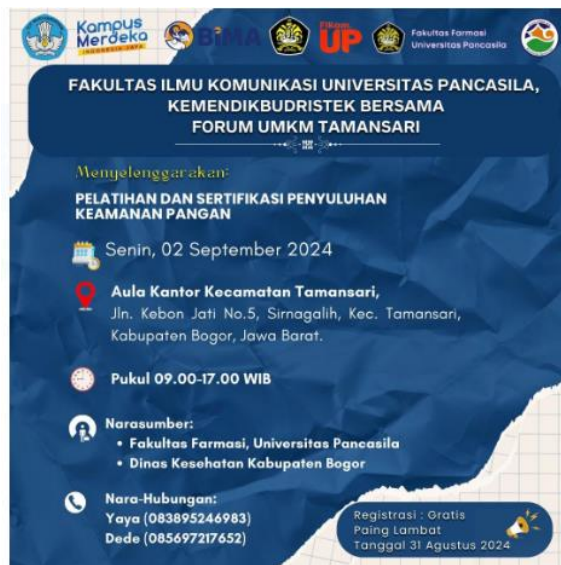
Gambar 2. Flyer digital yang disebar di WhatsApp Group Komunitas UMKM Teras Ciapus Mandiri dan Forum UMKM Kecamatan Tamansari

Pada tahapan sosialisasi, tim berkoordinasi untuk menentukan waktu dan lokasi kegiatan. Tim juga membuat flyer digital yang isinya informasi mengenai kegiatan pelatihan keamanan pangan. Flyer digital tersebut dikirimkan melalui aplikasi WhatsApp kepada Ketua Komunitas UMKM Teras Ciapus Mandiri dan Sekertaris Forum UMKM Kecamatan Tamansari untuk dibagikan kepada anggota masing-masing komunitas di WhatsApp Group masing-masing. Gambar 2 merupakan gambar Flyer digital yang disebar di WhatsApp Group Komunitas UMKM Teras Ciapus Mandiri dan Forum UMKM Kecamatan Tamansari. Flyer ini memuat informasi mengenai tema kegiatan pengabdian masyarakat, tanggal, lokasi, jam, narasumber dan nara hubung pada kegiatan ini.