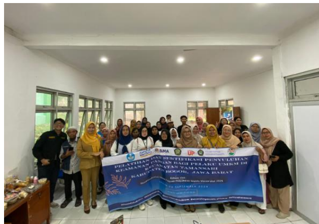
Gambar 5. Foto Bersama Peserta dan Pemateri

Para peserta juga diberikan kesempatan untuk berbagi kesan dan pesan selama mengikuti pelatihan, serta menyampaikan rencana mereka dalam mengimplementasikan pengetahuan yang didapat di kegiatan ini. Dengan berakhirnya sesi ini, diharapkan para pelaku UMKM Kecamatan Tamansari dapat menerapkan praktik keamanan pangan yang lebih baik dan mendukung keberlanjutan usaha mereka di masa depan. Tak lupa semua peserta diajak berfoto bersama dengan seluruh pemateri dan tim pelaksana pada kegiatan ini sebagai kenang-kenangan sebagaimana ditampilkan pada Gambar 5.