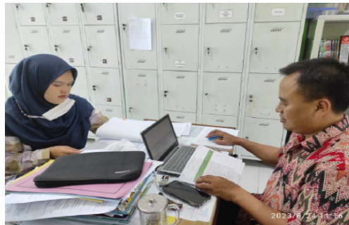
Gambar 1. Pembahasan pengadaan data yang diperlukan untuk kegiatan pengabdian dengan pihak MTs Asy Syaafiiyyah Kuwarasan

Sumber data yang digunakan berasal dari bendahara BOS, bendahara Yayasan, Operator Madrasah, dan Kepala Madrasah. Wawancara yang dilakukan kepada para pengelola madrasah dilakukan untuk mengetahui lebih rinci jenis permasalahan mereka dan bagaimana laporan keuangan madrasah tersebut dikelola.