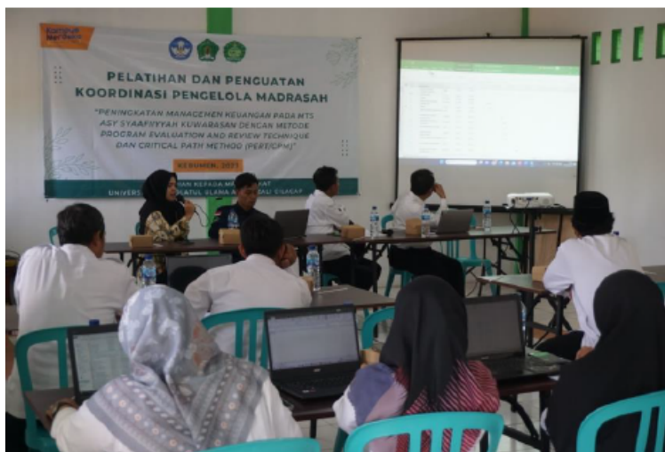
Gambar 4. Kegiatan pelatihan penggunaan metode PERT/CPM di MTs Asy Syaafiiyyah Kuwarasan.