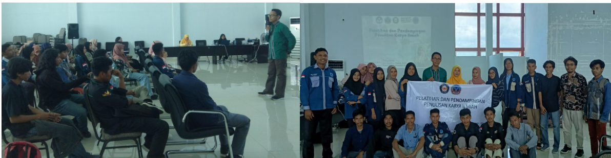
Gambar 1. Kegiatan pelatihan dan pendampingan penulisan karya ilmiah

Proses pelatihan penulisan diawali dengan pemberian pemahaman berupa materi terkait kaidah-kaidah dalam penulisan karya ilmiah. Karya tulis ilmiah disusun dengan memperhatikan unsur-unsur ilmiah yang telah ditetapkan baik dari institusi maupun dari pihak lembaga jurnal. Namun terdapat kaidah umum yang harus dimiliki oleh mahasiswa dalam penulisan karya tulis ilmiah. Teknik penulisan dilatih mulai dari penggunaan kata atau kalimat baku yang sesuai dengan panduan Kamus Besar Bahasa Indonesia (KBBI), selanjutnya diperkenalkan menggunakan fitur dalam Microsoft word dan excel dalam mengelola data dan memfisualkan data. Setelah memahami kaidah dasar tersebut pengembangan materi hingga proses penggunaan beberapa aplikasi seperti canva dalam hal membuat presentasi yang baik dan menarik.