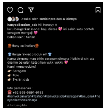
Gambar 6. Caption Instagram @hanycollection_sda