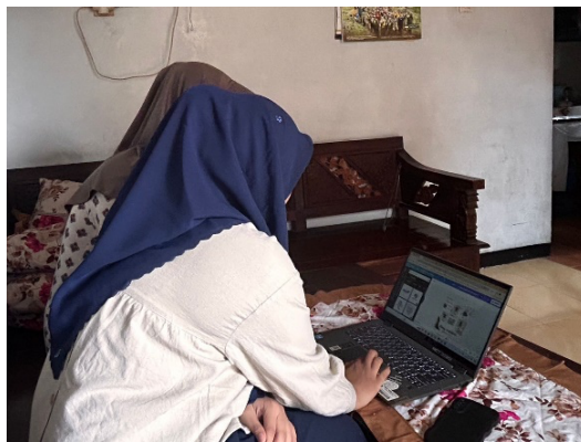
Gambar 10. Proses pembuatan Feed Instagram