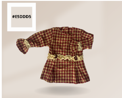
Gambar 8. Hasil Editing Foto Produk yang Menarik dan HTML Kode Warna