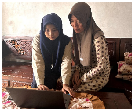
Gambar 3. Proses editing logo