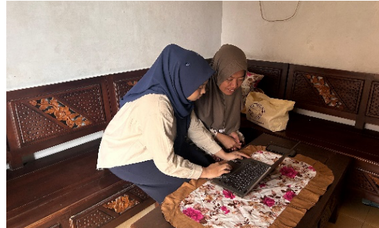
Gambar 9. Proses editing foto produk