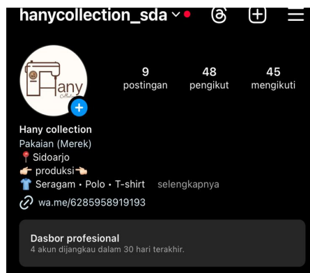
Gambar 12. Data kunjungan profil pada akun Instagram @hanycollection_sda