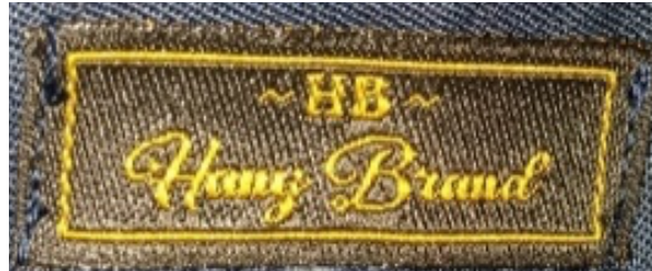
Gambar 2. Logo sebelum re-design

Sebelumnya Hany Collection sudah memiliki logo namun hanya berbentuk tulisan yang berwarna kuning keemasan. Menurut pengabdian logo sebelumnya sudah bagus namun masih belum dapat menjelaskan makna dari home industry Hany Collection yang menaungi bidang fashion, karena alasan itulah pengabdian ingin mengupgrade logo sebelumnya dengan logo yang baru.