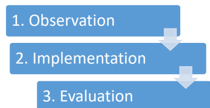
Gambar 1. Proses pelaksanaan kegiatan

pengetahuan tentang rebranding di media sosial agar produk lebih dikenal oleh konsumen, yang mana tujuan dari branding itu untuk membangun persepsi yang baik dari segi pesan dan kesan suatu brand dalam pemikiran dan perasaan konsumen. Dengan cara membuat sebuah akun instagram, membuat feed Instagram, membuat foto produk menjadi lebih menarik dan juga membuat logo baru. Kegiatan pendampingan ini dilaksanakan pada tanggal 1- 3 Juli 2023. Metode yang dilakukan kegiatan proses rebranding melalui media social Instagram pada home industry Hany collection yang berada di desa Banjar Panji dilakukan secara luring dan diikuti oleh home industry Hany Colection dengan jumlah peserta 1 orang terdiri dari pemilik Hany Collection . Home industry hany Collection ini dipilih karena kurang dikenal oleh masyarakat padahal sudah lama memproduksi pakaian namun tidak memiliki akun media sosial khususnya instagram yang dapat digunakan sebagai media promosi produk gratis. Berikut tahapan metode kegiatan :