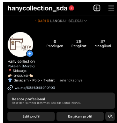
Gambar 5. Isi Bio Instagram @hanycollection_sda