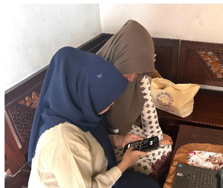
Gambar 7. Proses pembuatan bio dan caption Instagram @hanycollection_sda