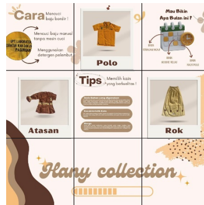
Gambar 11. Hasil Feed Instagram