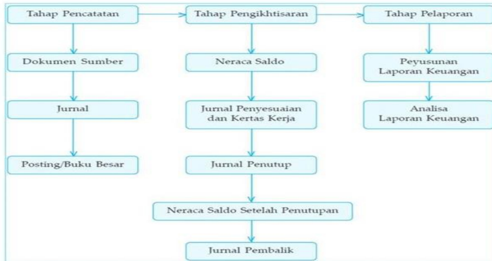
Gambar 4. Siklus akuntansi

ini bisa menghasilkan nilai bagi pasar dan dalam perusahaan atau organisasi. Proses bisnis ini memiliki Langkah-langkah yang sesuai dengan sub proses yang akan di bahas. Contohnya sub proses pemasaran, sub proses produksi, sub proses bahan baku dal lain-lain. Sedangkan siklus akuntansi adalah proses posting ke buku besar, menyusun neraca saldo, menyusun jurnal penyesuaian, menyusun kertas kerja atau neraca lajur, menyusun laporan keuangan, dan menyusun jurnal penutup.