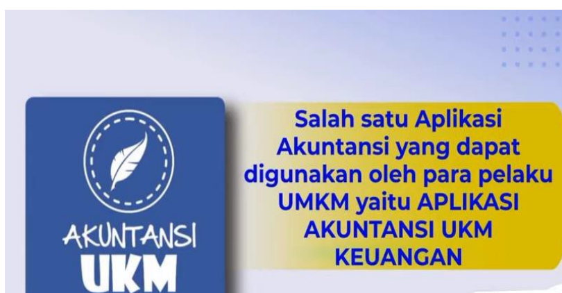
Gambar 2. Aplikasi Akuntansi UKM Pelaksanaan kegiatan Pengabdian Kepada Masyarakat

Pelaksanaan kegiatan Pendampingan Penyusunan Laporan Keuangan Berbasis SAK-EMKM dengan aplikasi akuntansi UKM ini adalah untuk UKM Kue Kering “Prima Rasa” selaku Mitra. Dalam kegiatan pendampingan penyusunan laporan keuangan berbasis SAK-EMKM dengan aplikasi akuntansi UKM ini dilaksanakan pada tanggal 5 Mei 2021 sampai 5 Juni 2023 bertempat di Jl. Masjid Al-Islah 197 Kecamatan Ngasem Kabupaten Kediri Jawa Timur.