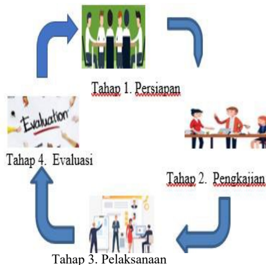
Gambar 1. Bagan Alur Pelaksanaan Pengabdian

Sebagaimana disebutkan dalam identitas dan perumusan masalah di atas bahwa persoalan yang akan dijadikan fokus dalam program pengabdian ini adalah kurangnya pemahaman mengenai pembuatan Laporan Keuangan dengan aplikasi UKM, oleh karena itu diperlukan pendampingan.