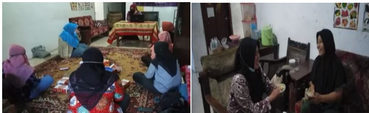
Gambar 3. Pemberian materi kepada mitra

Menurut (Paul Harmon, 2003), dalam bukunya “Business Process Change”, definisi proses bisnis adalah kegiatan yang dilakukan dalam kegiatan jual beli atau bisnis yang didalamnya terdapat input, perubahan dari suatu informasi dan akhirnya akan menghasilkan output. Output